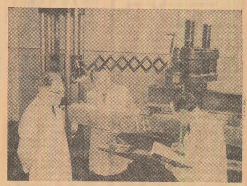
Institutul de cercetări al căilor ferate din București: se încearcă traversa din beton precomprimat