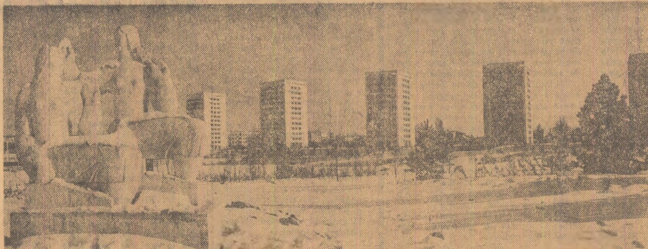
Detalii sugestive într-un peisaj ce se înfrumusețează: în parcul Floreasca din Capitală a fost expusă această operă plastică — „Bucuria muncii” — aparținînd sculptorului Emil Mereașu.

Supravegherea telului în care se desfășoară formarea copilului în familie, evaluarea obiectivă a progreselor realizate cit și a celor cărora abia li se pun temelile — iată obligații strict părintești, dar care, fără un sprijin venit din afară — școală, organizație, societate în general — nu au întotdeauna sorți de izbîndă. Formula „las-că știu eu mai bine cum e copilul meu !”, cu alte cuvinte părintele care socotește că descoperă instantaneu ceea ce simte și gîndește copilul său, e tipul de părinte cel mai vulnerabil din punct de vedere educativ.