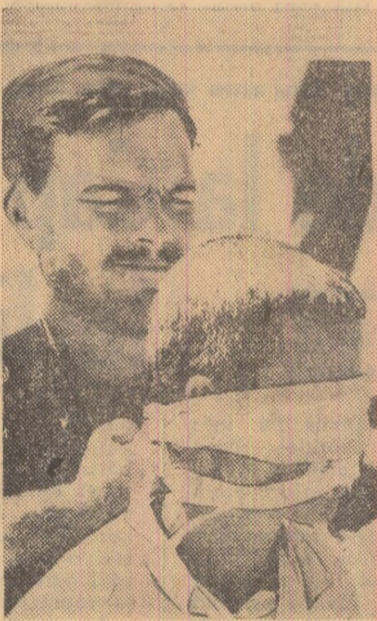
În Vietnamul de sud. În apropierea de baza militară a S.U.A. de la Da Nang, un pușcăz marin american lozga la ochi pe un patriot sud-vietnamez făcut prizonier