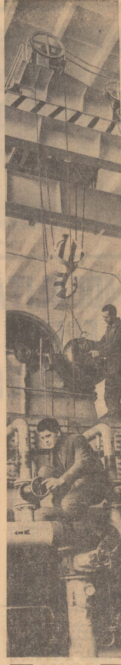
Combinatul de îngrășăminte chimice Tr. Măgurele; se lucrează la montarea turbo-compresoarelor fabricii de amoniac.