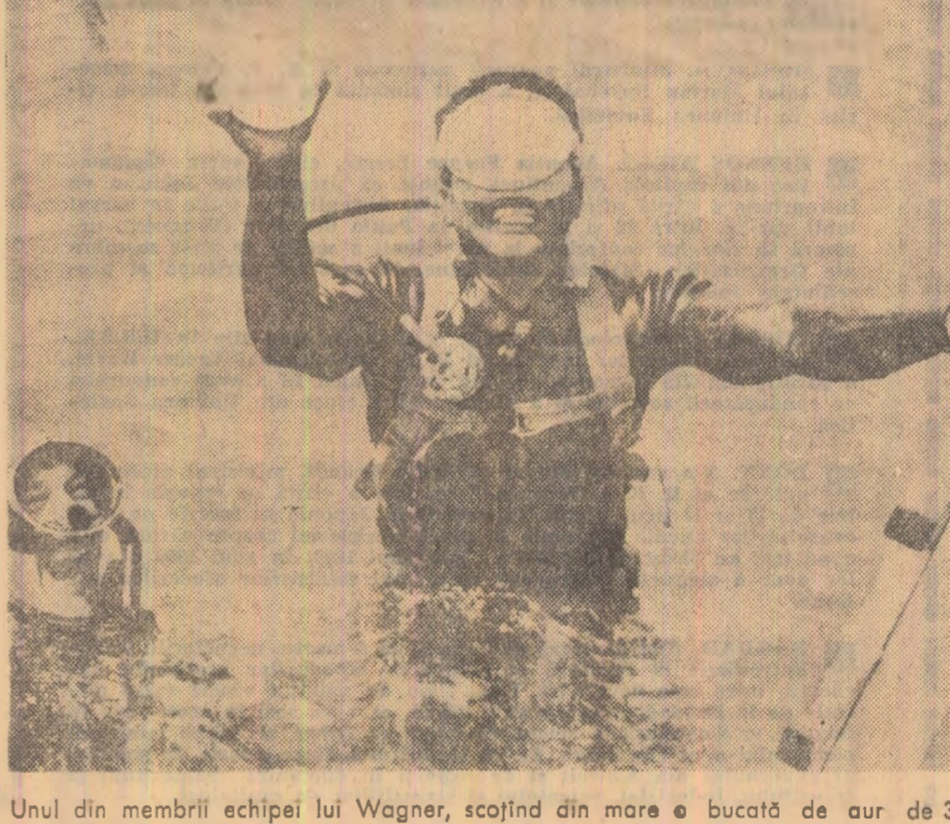
Unul din membrii echipei lui Wagner, scofină din mare o bucată de aur de 3 kg.