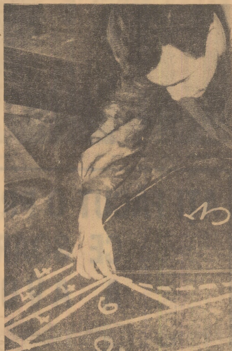
În atelierul de debitare din secția a VI-a a uzinei „Semănătoarea”-București: prin croirea combinată a tablei se economisesc însemnate cantități de metal la fabricarea combinelor pentru recoltat cereale