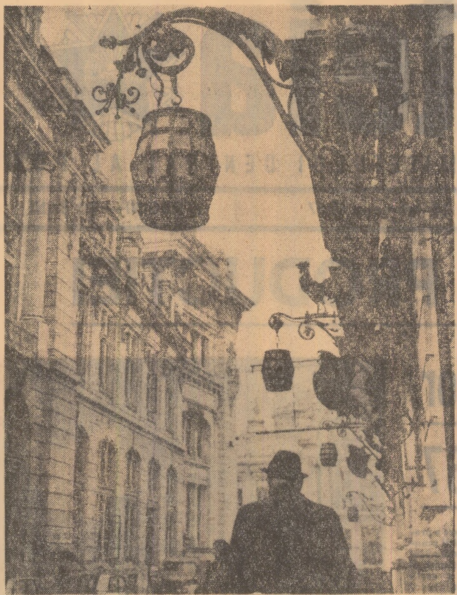
Felinarele-butoi de la „Carul cu bere” din Capitolă