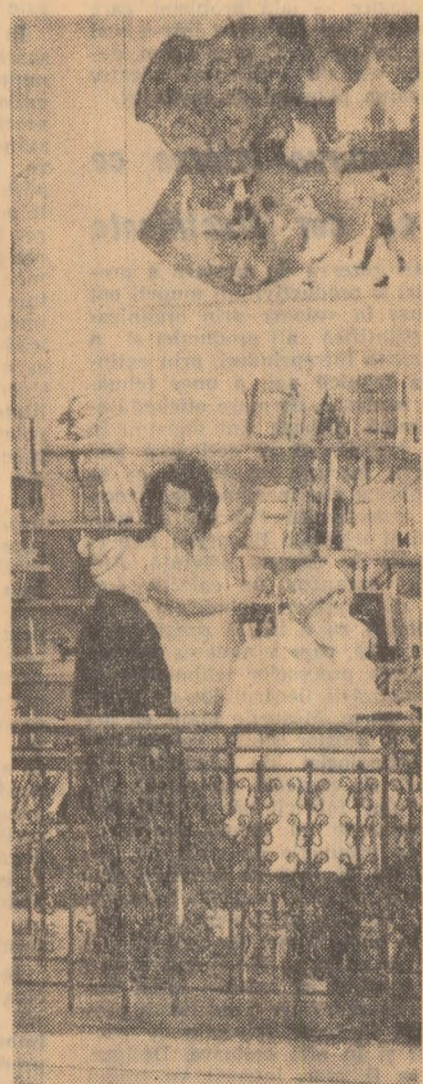
În secția copil a bibliotecii regionale din Tg. Mureș.

Corectarea tezelor implică o muncă răbdătoare, pătrunsă de simțul răspunderii. Iar analiza lor nu poate să nu devină o adevărată lecție, izvoată, de această dată, nu din prescripțiile programelor, ci din cerințe directe care tin de nivelul real de cunoștințe al clasei, de gradul de dezvoltare al colectivului respectiv de elevi, de viața clasei. Vînzînd însă mai departe decît cerințele de moment ale procesului instructiv-educativ, cred că e de datoria noastră să folosim teza pentru a cultiva capacitatea de a elabora în scris — capacități de mare utilitate atît pentru tinerii care după ani de școală se vor consacra muncii în producție cît și pentru cei care vor îmbrățișa o activitate intelectuală.