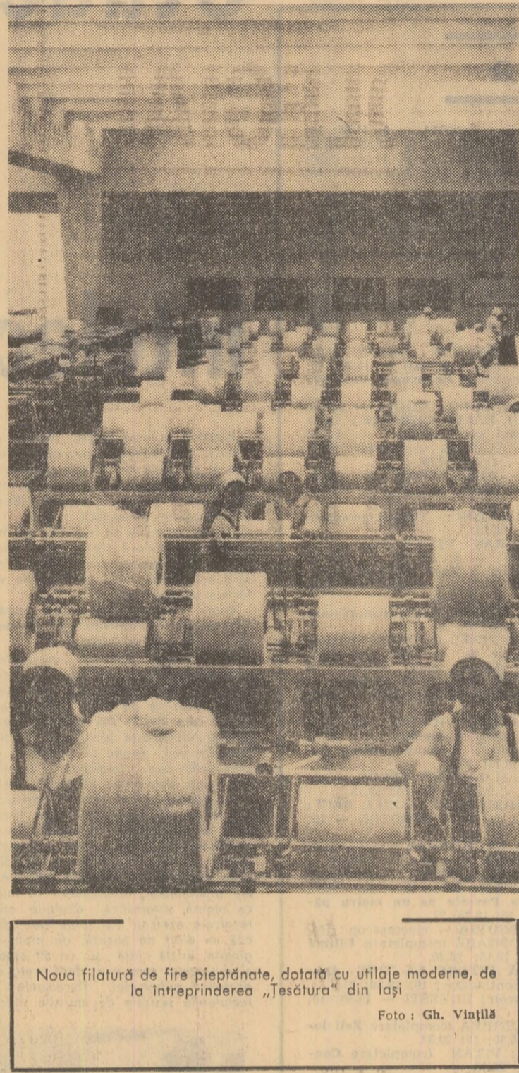
Noua filatură de fire pieptănate, dotată cu utilaje moderne, de la întreprinderea „Iesitura” din Iosif