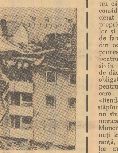
Furtuna care s-a abătut zilele trecute asupra teritoriului R. F. o Germaniei a provocat numeroase avarii clădirilor din orașul Bayreuth

CAPE TOWN. Primul ministru al Rhodesiei, Ian Smith, a sosit „într-o scurtă vizită” la Capetown (R.S.A.).