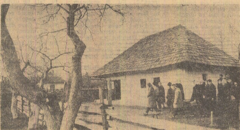
În aceste zile, la împlinirea a 130 de ani de la nașterea lui Ion Creangă, Casa memorială din Humulești cunoaște un afluz de vizitatori

Mulțumind călduros pentru mesajul primit, emirul Sabah al Salem al Sabah a adresat președintelui Consiliului de Stat, Chivu Stoica, urări de ferice personală, de prosperitate Republicii Socialiste România.