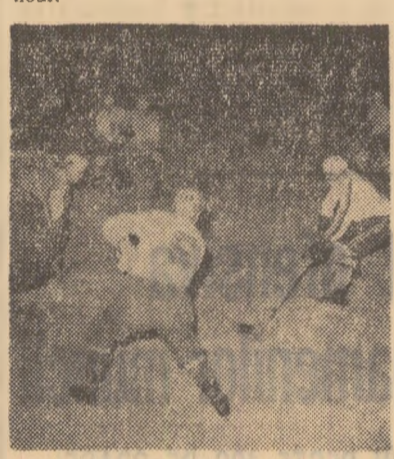
Fază din partida de aseară România-R.F.G.

Cele două selecționete se vor întâlni din nou mîine seară, pe același patinoar.