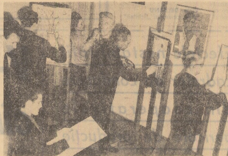
O imagine obișnuită la Casa de creație populară a Capitalei. Artiștii plastici amatori la lucru.