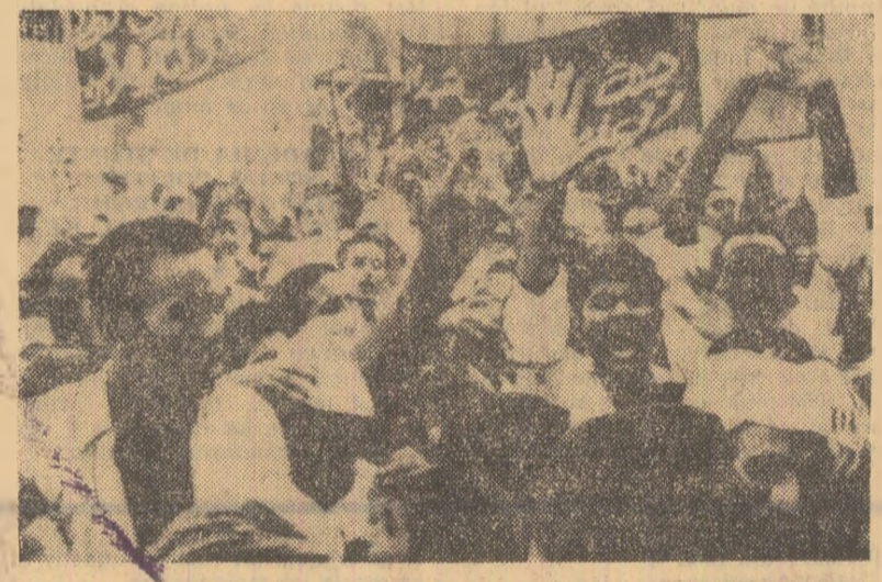
ADEN — Pentru a treia zi consecutiv, întregul Aden a fost paralizat joi de greve generală declarată marți, în semn de do-lu, după asasinarea celor trei fiți ai secretarului general al Frontului de eliberare a sudului ocupat al Yemenului (FLOSY).