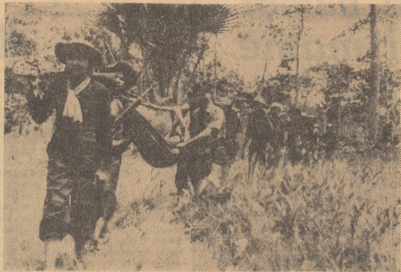
O coloană de luptători din forțele patriotice sud-vietnameze înaintînd prin junglă