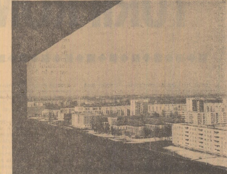
Tînrul cartier gălățean — Țiglina II

Faima gospodăriei agricole de stat — Huși a crescut mult prin realizarea unei producții de struguri și de vinuri de bună calitate. Ea a obținut, la recentul concurs regional de vinuri, 12 medalii de aur, 10 de argint și 3 de bronz pentru partizi mari, în special la vinuri de larg consum — albe și roșii.