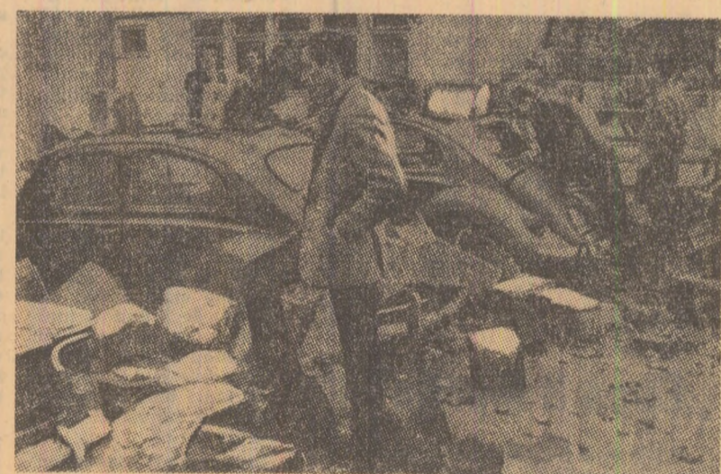
Frankfurt pe Main. Automobile avariate în urma prăbușirii unui zid sub presiunea furtunii

● Vănturile strîmte de vînt pe ambele maluri ale Atlanticului au atîns o înălțime între 2,65—2,75 metri. Nu departe de coastele insulei Newfoundland a fost zărită epava vasului de pescuit „Polly and Robby”, dat dispărut de citeva zile.