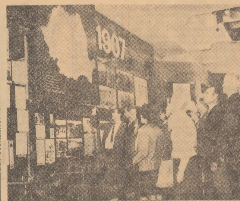
Un grup de cooperatori din raionul Buzău au vizitat ieri Muzeul de istorie a partidului comunist, a mișcării revoluționare și democratice din România. Iată-i în fața exponatelor care ilustrează aspecte ale răscoalelor țărănești din 1907

La clubul Fabricii de confecții „Mondiala” Satu Mare a fost prezentat un jurnal vorbit cu tema „Răscoala din 1907 — una din paginile glorioase ale luptei sociale a poporului român”, urmat de recitari de versuri din ciclul „1907” de Tudor Arghezi. (Agerpres)