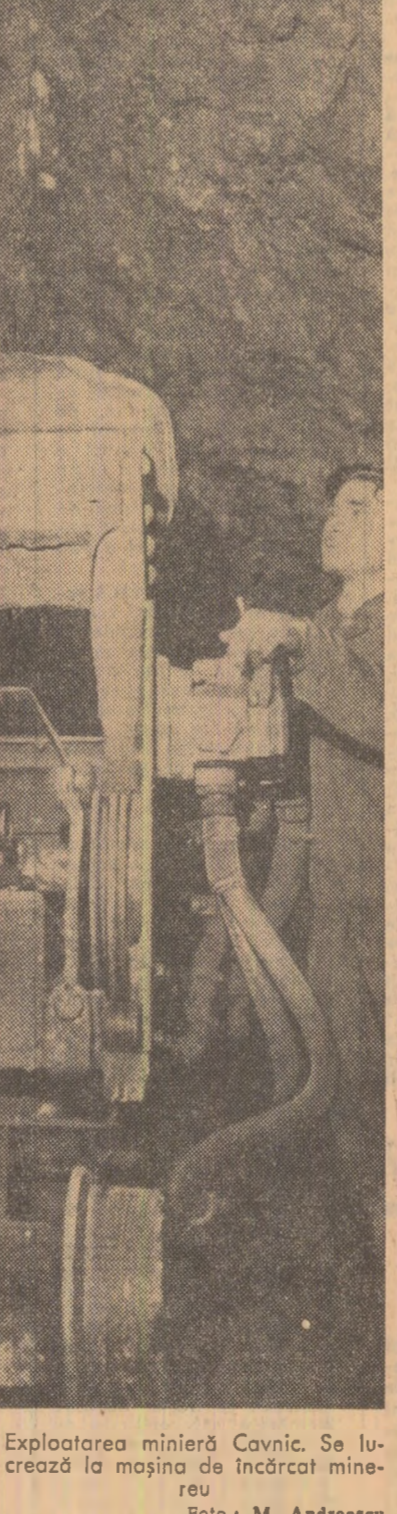
Exploatarea minieră Cavnic. Se lucrează la mașina de încărcat minereu.

AI. GHEORGHIU (Continuare în pag. a V-a)