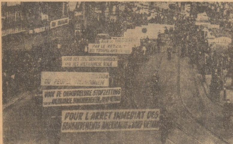
Reprezentanții ai populației din diferite regiuni ale Belgiei s-au întrunit la Bruxelles într-o impudantă demonstrație „pentru încetarea imediată a bombardamentelor americane în Vietnamul de nord”

„La 18 luni înainte de alegerile prezidențiale, ostilitățile sînt deschise între președintele Johnson și dl. Robert Kennedy, senatorul statului New York a luat inițiativa în momentul cînd președintele a hotărît să intensifice conflictul vietnamez. Formula d-lui Kennedy a frapat durător personalitatea autorului ei, ale cărui propuneri retin atenția opiniei publice mondiale, a membrilor Congresului și a administrației americane”. Dezbaterea cu privire la războiul din Vietnam, continuă și dincolo de sfera vieții politice propriu zise. Astfel, la New York, în momentul cînd vicepreședintele S.U.A., Hubert H. Humphrey, se pregătea să țină discursul inaugural la ceremonia de acordare a premiilor naționale ale cărții, în sala „Philarmad Hall”, președintele Mitchell Goodman s-a adresat vicepreședintelui: „Nu ardem copiii în Vietnam, fapt de care sîntem cu toții răspunzători”. El a părăsit apoi sala, urmat de aproximativ 100 de persoane.