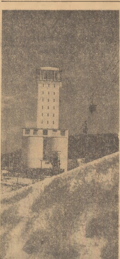
Noul puț de extracție și funicularul de la exploatarea minărilor Aninoasa

Izbuent în nordul Moldovei, marele uragan social din 1907 s-a întins cu iuteala fulgerului pe terenul nemulțumirilor de veacuri, cuprînzînd aproape întreaga țară. Nicînd pînă atunci pămîntul patriei, inobit de singele curs în rupele purtate de-a lungul secolelor de poporul român pentru păstrarea ființei sale naționale și libertate socială, nu cunoscuse o mai mare ridicare a maselor țărănești.