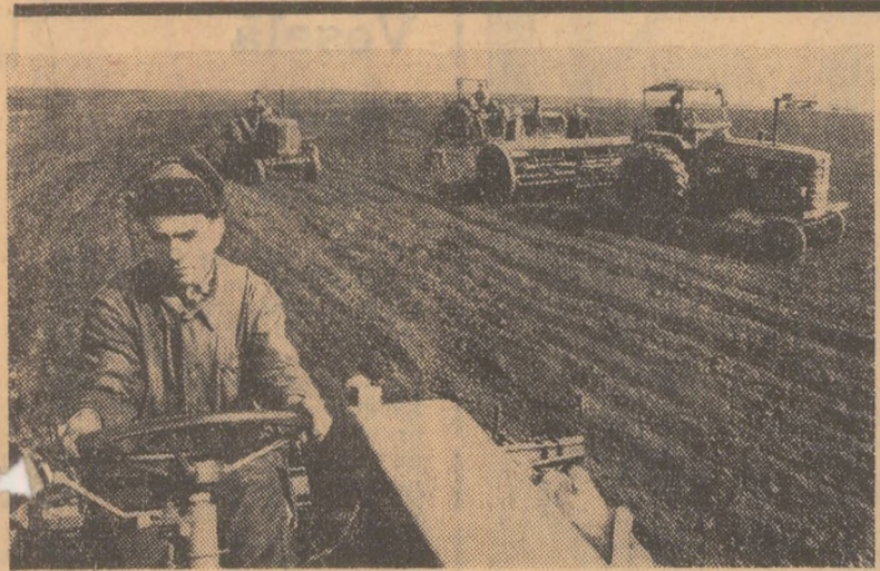
G.A.S. Văceni, raionul Drăgănești-Vlașca; Tractoarele au ieșit la cîmp