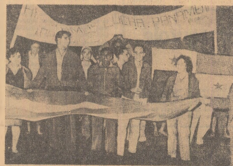
Locuitorii ai capitalei panameze demonstrînd pentru trecerea canalului sub suveranitatea statului Panama

Comentînd conferința de presă a președintelui Johnson, ziarul „New York Times” a scris într-un editorial apărut vineri dimineață că „o dată în plus și pentru motive citate de zece ori, președintele a refuzat să preconizeze o încetare a bombardamentelor asupra Vietnamului de nord”. „Politica actuală, continuă ziarul, nu face decât să ducă la un război îndelungat, crud și costisitor, care nu poate să aducă o victorie comparabilă cu prețul tragic ce trebuie plătit”.