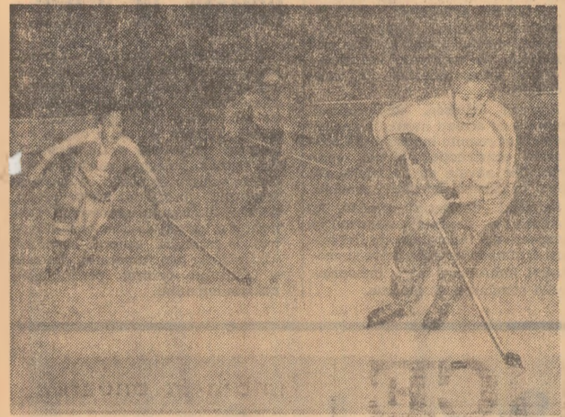
Fază din al doilea meci de hochei pe gheață dintre selecționata Bucureștilor și formația cehoslovacă Tesla Pardubice, desfășurat aseară pe patinoarul „23 August” din Capitală. Oaspeții au câștigat cu scorul de 7-3 (1-2, 2-0, 4-1)