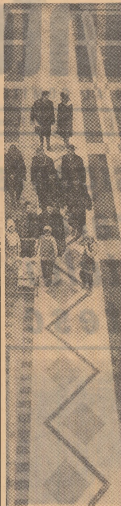
Promenadă la Suceava

Cînd posteritatea își apleacă stîndardul în fața memoriei răscolitelor — a spus în încheiere vorbitorul — ea absoarbe noi puteri din acest izvor de tîrzie și fidelitate pentru traducerea în viață a mărețelor sarcini ale prezentului. Astfel, trăiesc ei prin inimile și brațele noastre și astfel vom trăi și noi, epoca noastră constructoare, eroică, socialistă, prin cei care ne vor urma.