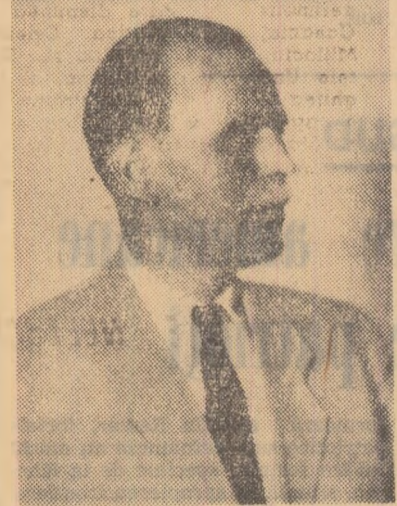
Partidului Comunist Român a fost ales membru al Comitetului Central și membru supleanț al Biroului Politic, iar din 1955 și pînă în 1965 a făcut parte din Comisia Centrală de revizii a Partidului Comunist Român.

Pentru activitatea sa neobosită pusă în slujba clasei muncitoare, a fărurii puterii populare și construirii socialismului a fost distins cu ordine și medalii ale Republicii Socialiste României.