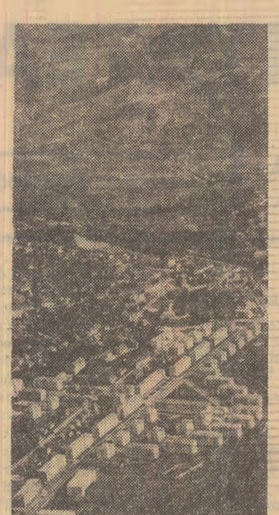
Brașov — orașul minier din inima munților Apuseni