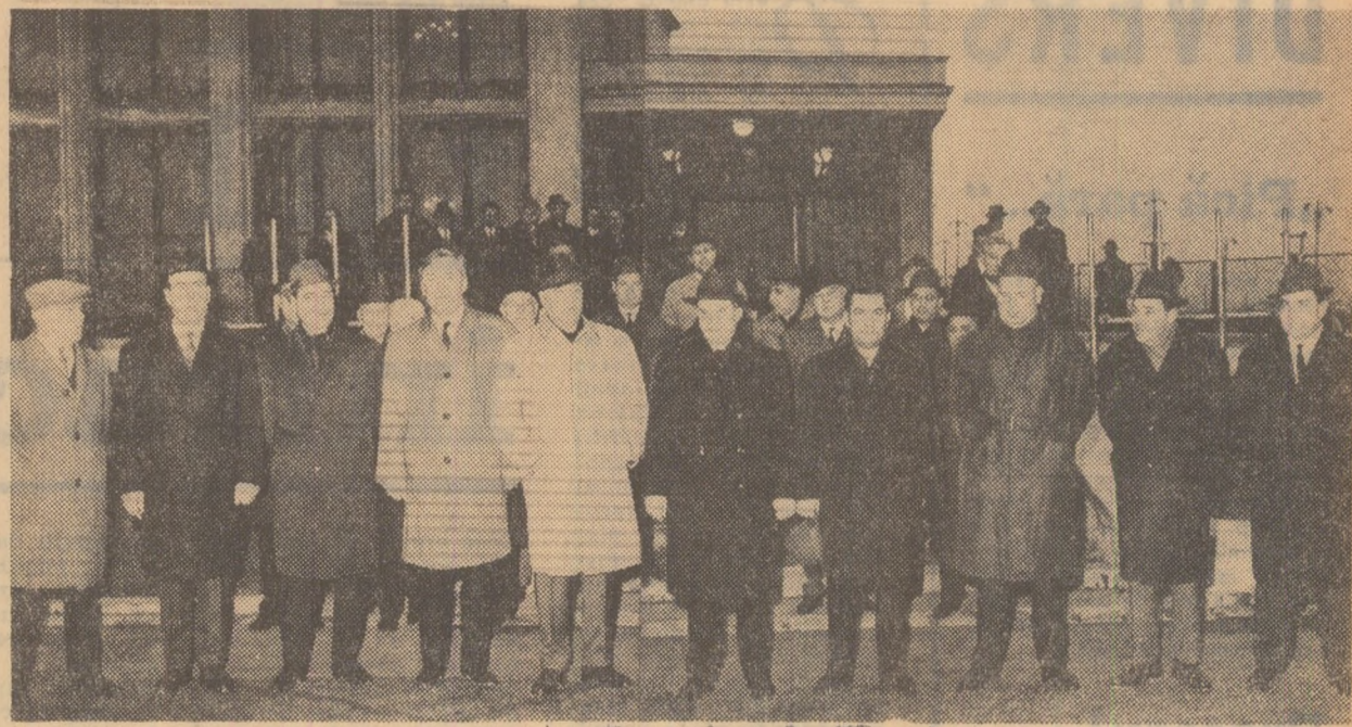
La plecare, pe aeroportul Băneasa

Vineri dimineața, au părăsit Capitala, îndreptîndu-se spre Moscova, tovarășii Nicolae Ceaușescu, secretar general al Comitetului Central al Partidului Comunist Român, Ion Gheorghe Maurer, membru al Comitetului Executiv, al Prezidiului Permanent al C.C. al P.C.R., președintele Consiliului de Miniștri al Republicii Socialiste România, și Paul Niculescu-Mizil, membru al Comitetului Executiv, al Prezi-