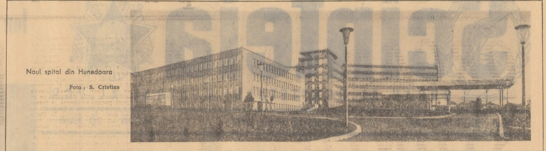
Noul spital din Hunedoara

Un consum mai mare de apă are însă drept consecință directă eva- cuarea unui volum cora- pundător de ape uzate. Și cum în majoritatea cazu- rilor resursele hidrologice ale țării. Problema poluării, dacă nu este examinată din timp și cu suficiență răspundere, poate face ca apele hidrologice ale țării să devină din folositoare — dăunătoare, alți pentru fauna și flora acvatică, cît și pentru om. Iată de ce asigurarea condițiilor