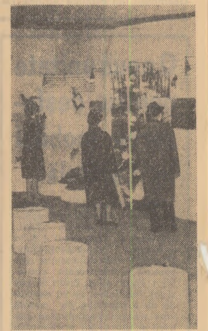
Locuitorii ai capitalei austriece în vizită la pavilionul românesc, deschis cu prilejul Tîrgului internațional de la Viena

GENEVA 17. — Corespondentul Agerpres transmite: Comisia O.N.U. pentru drepturile omului a adoptat patru rezoluții privind problema violării drepturilor omului și a libertăților fundamentale, inclusiv politica de discriminare rasială și segregare. Una din rezoluții prevede, de asemenea, numirea unui raportor special care va examina modul în care au acționat Națiunile Unite pentru a elimina manifestările politicii de apartheid în Africa de Sud, Africa de Sud-Vest și Rhodesia de sud. Comisia a hotărît să examineze în fiecare an aspectele discriminării rasiale, segregării, ca și ale politicii de apartheid.