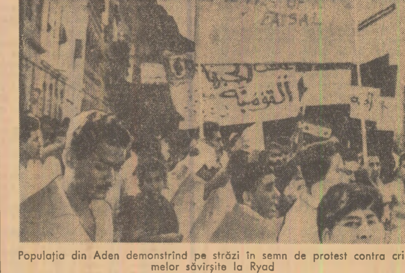
Populația din Aden demonstrează că vor fi în semn de protest contra crimelor săvîrșite la Ryad