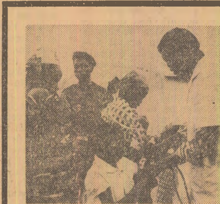
Bamaka. La un centru de vaccinare antiviralică a copiilor

Referindu-se la problema construcției de locuințe, ridicată în discuție pe marginea raportului, W. Gomulka a arătat că în cursul acestui cîincinal vor fi construite 100.000 de apartamente pentru lucrătorii din gospodăriile agricole de stat.