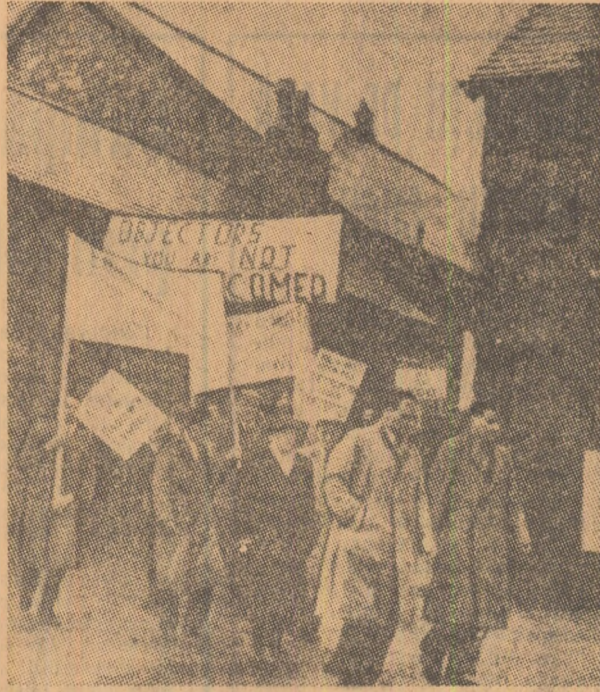
Anglia. Muncitorii din Tara Galilor participind la un marș de protest împotriva concedierilor

SOFIA 23 (Agerpres). — Agenția B.T.A. transmite că Biroul Consiliului de Miniștri al R. P. Bulgaria a adoptat o hotărîre care reglementează statutul uniunilor economice de stat. Acestea sînt forme organizatorice noi ale conducerii centralizate a întreprinderilor din aceeași ramură sau din ramuri înrudite, grupate conform unor criterii legate de procesul de producție. Păstrîndu-și independența juridică și economică, întreprinderile încadrate în uniuni vor fi conduse de un consiliu economic, de un birou executiv și de directorul general. Noua hotărîre stabilește sarcinile care revin fiecărui organ de conducere și prevede ca toate verigile economice să funcționeze potrivit principiului gospodăririi chibzuite. Printre altele se prevede ca sporirea fondului de salarii destinat aparatului de conducere să depindă de creșterea beneficiilor uniunii.