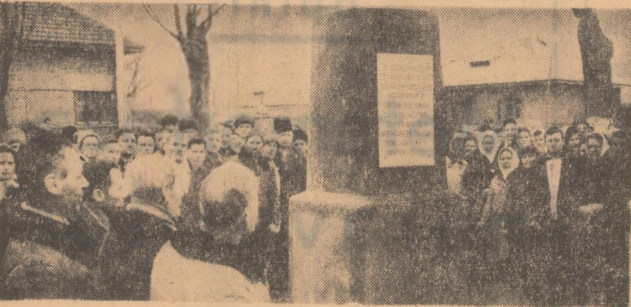
Zilele acestea a avut loc dezvelirea unei plăci comemorative în comuna Podu Iloaiei regiunea Iași