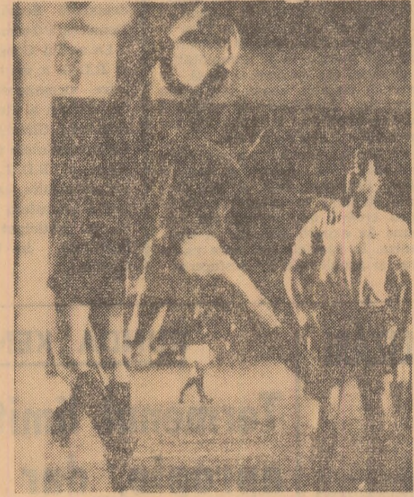
La o lovitură de colț executată de fotbalistii români