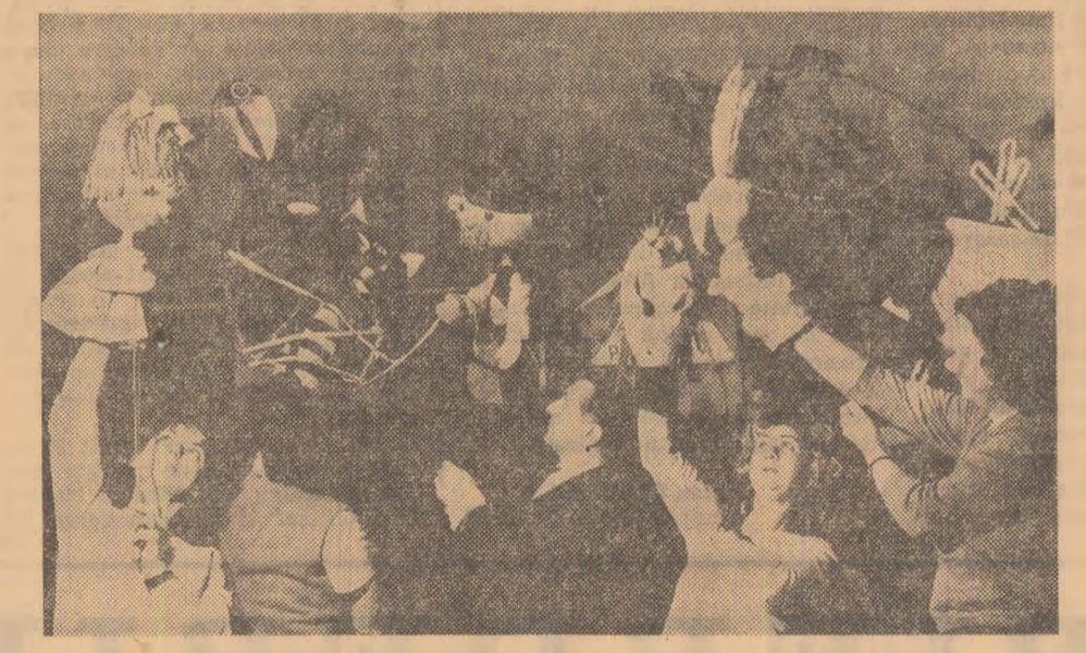
Premieră la Teatrul de păpuși din Galați: „Ce mi-a povestit pădurea”