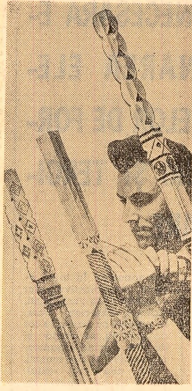
Broderie în lemn. (La secția de sculptură a școlii populare de artă din Bacău)