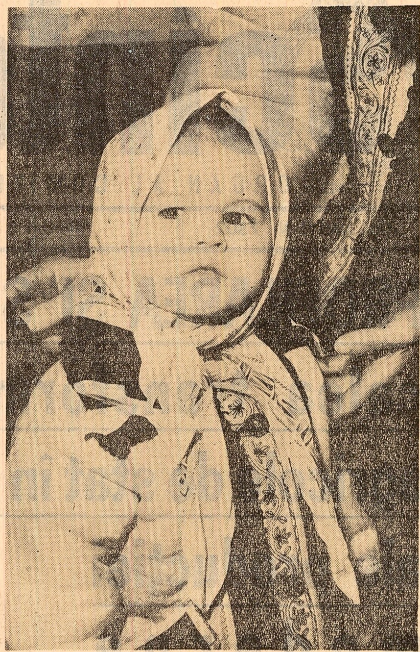
Învăj prima poezie

După scoaterea din cuptor, cozonacii sînt puși într-un belsug cu zahăr și ambalați în punși de polietilenă pentru a ajunge cît mai proaspeți în mîna cumpărătorilor.