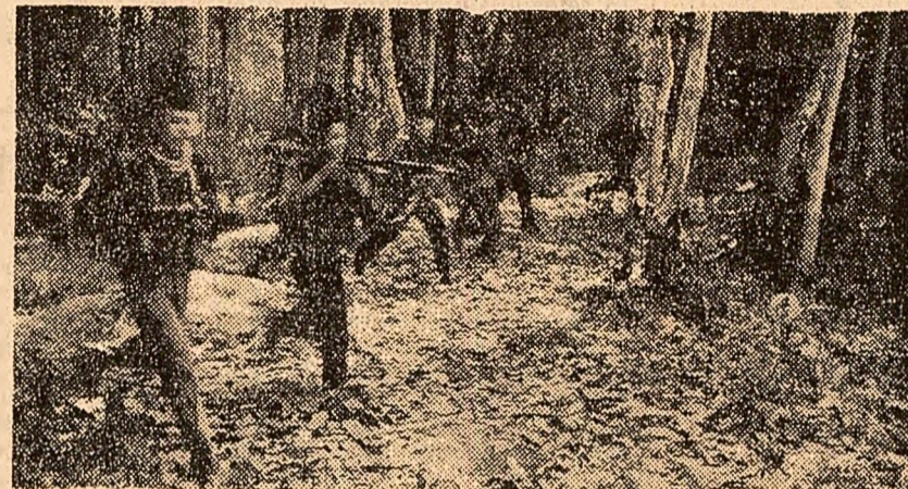
Un grup de patrioți sud-vietnamezi înainteză prudent prin desișul pădurii pentru a surprinde pe inamic