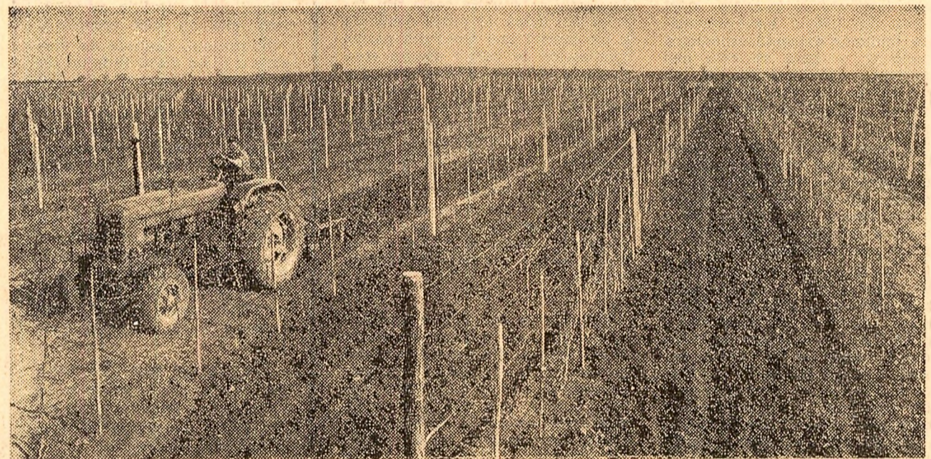
Lucrări de întreținere a viței de vie la Stațiunea experimentală Greaca, regiunea București