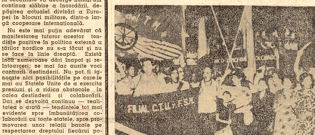
Peste 150 de muncitori și studenți din capitala Urugvayului au început un marș de protest spre Puntea del Este, pentru a-și exprima protestul față de organizarea conferinței șefilor de state ai țărilor membre ale O.S.A.

INVESTIȚII STRAINE ÎN ITALIA. Societățile străine au făcut în anul trecut investiții în valoare de 66,9 miliarde lire, cu 10 miliarde lire mai mult decît în 1965. Din această sumă, 37,4 miliarde lire revin firmelor americane, 8,2 miliarde lire celor elvețiene și 2,7 miliarde întreprinderilor engleze.