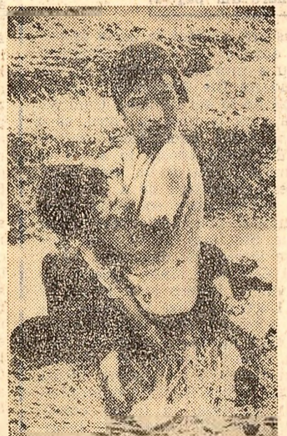
O imagine obișnuită din Vietnam de sud: copii, mame, tineri fug din fața ororilor războiului, și își caută refugiu în delți

SOSIREA LA TEHERAN A PREȘEDINTELUI CONSILIULUI SUPERIOR AL AGRICULTURII, NICOLAE GIOSAN, care face o vizită în Iran, la invitația ministrului agriculturii din această țară. Sâmbătă el a fost primit de Amir Abbas Hoveyda, primul ministru al Iranului. Convorbirea a decurs într-o atmosferă cordială.