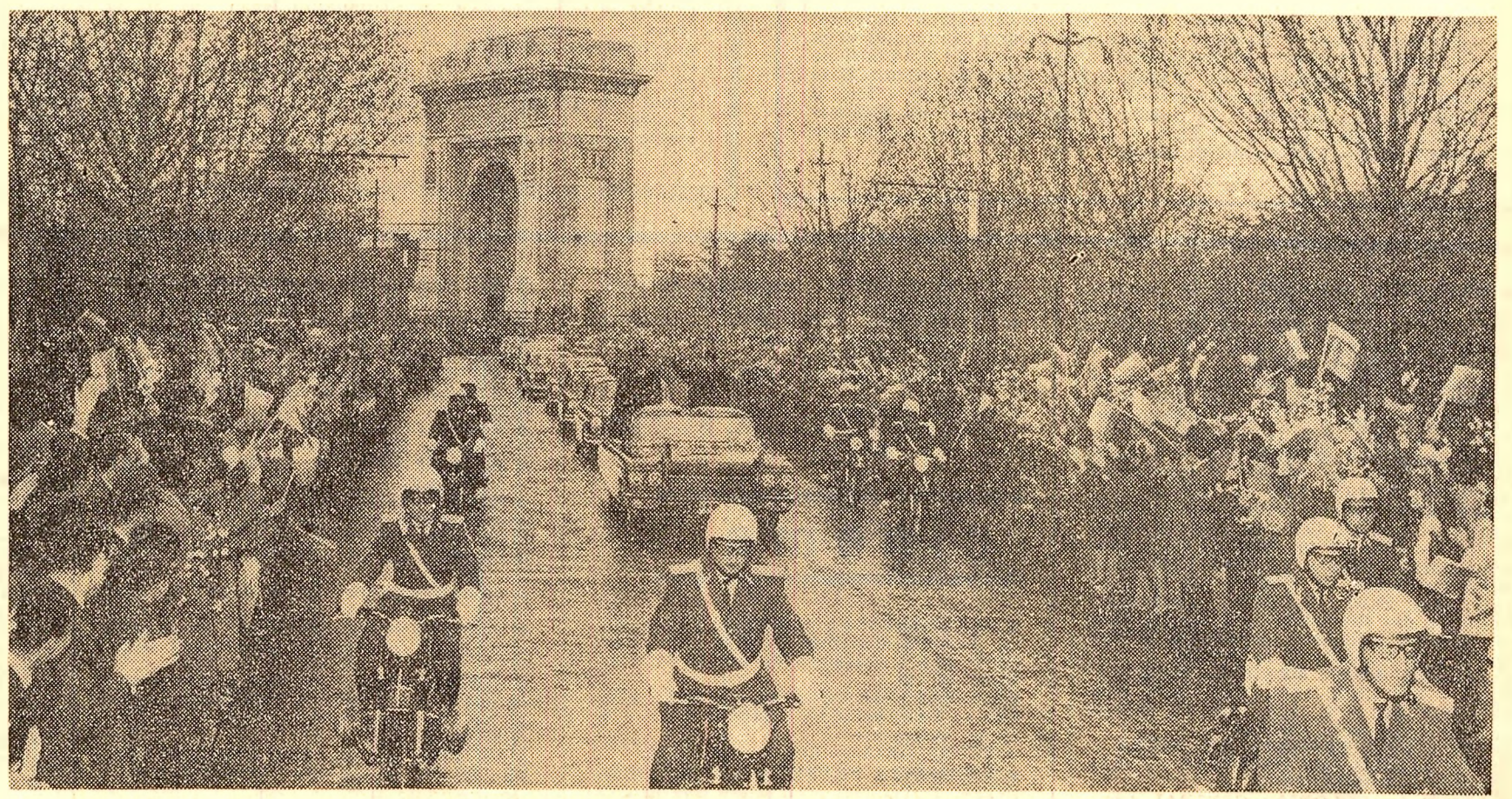
Mii de locuitori ai Capitalei fac o călduroasă primire solilor poporului bulgar