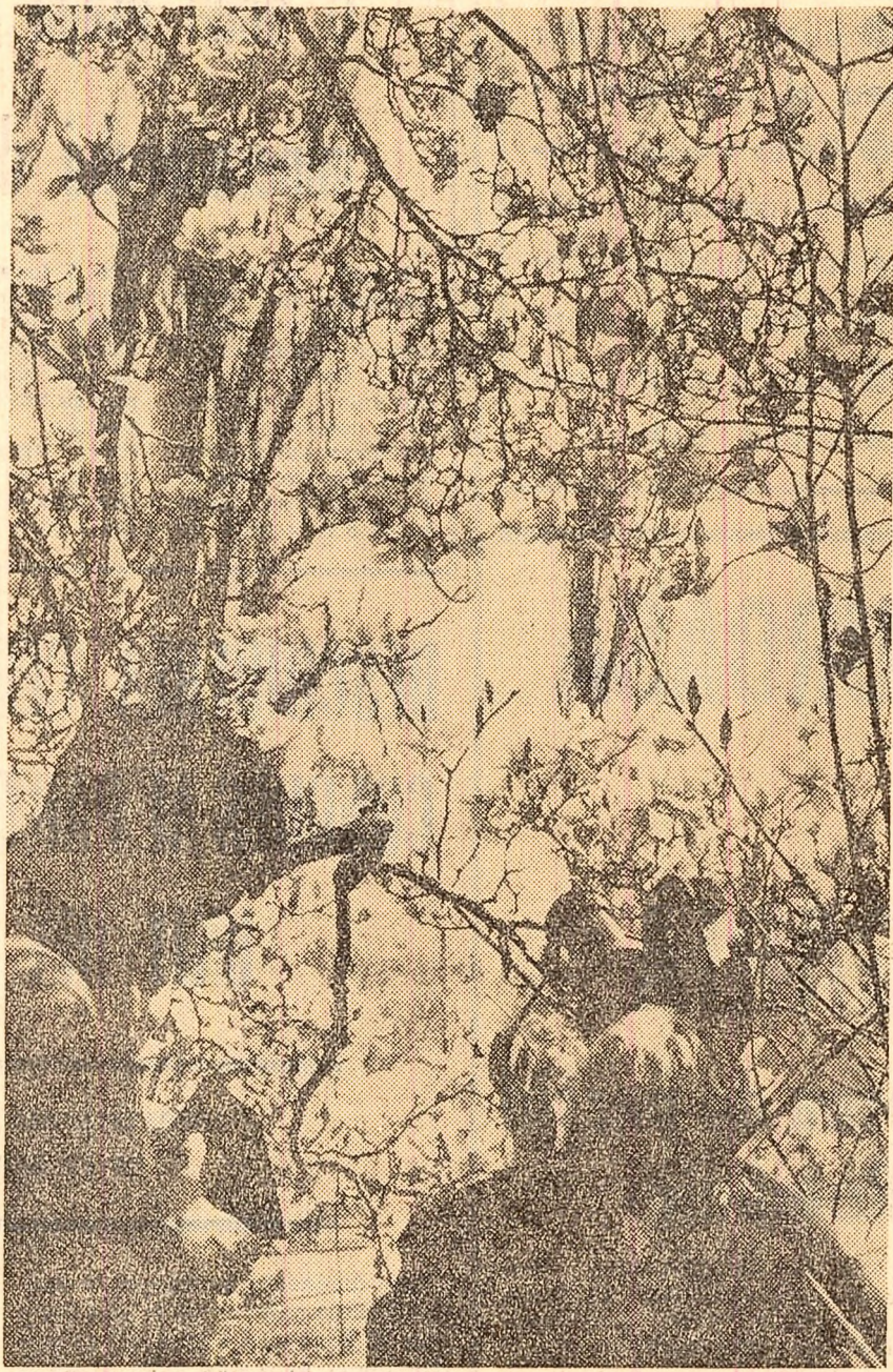
Imagini de primăvară: magnoliile în floare

Rubrică redactată de Stefan ZIDĂRIȚĂ Stefan DINICĂ cu sprijinul corespondenților „Scinței”