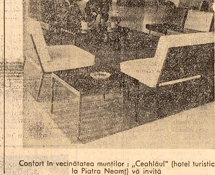
Confort în vecinătatea muntilor: „Ceahlău” (hotel turistic la Piatra Neamț) vă invită