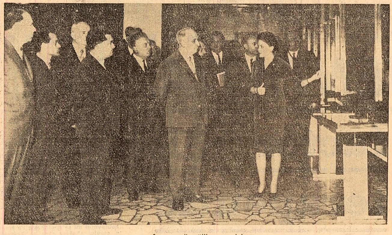
Într-una din sălile muzeului