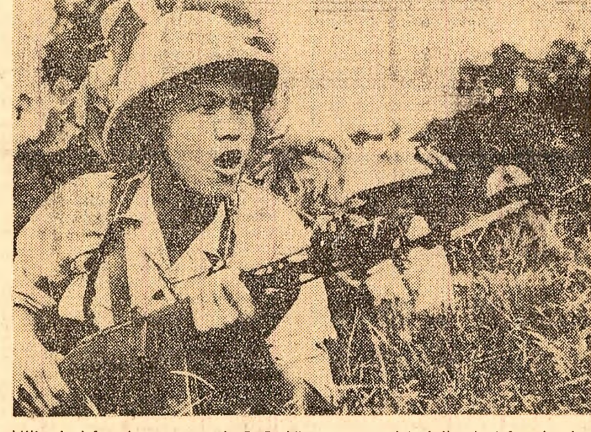
Militari ai forțelor armate ale R. D. Vietnam, paznici vigilenți ai frontierelor țării, în timpul unui exercițiu de luptă