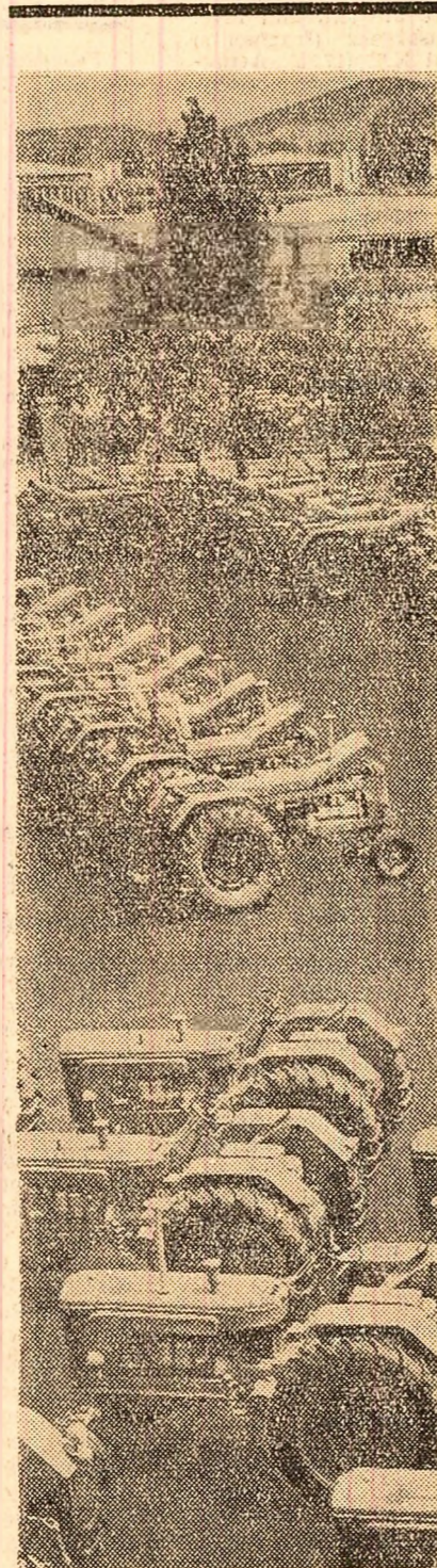
La uzinele „Tractorul” din Brașov

În Anul turistic internațional — 280.000 de turiști străini transportați pe calea aerului • Excursii cu avionul în regiuni pitorești ale țării • Mai multă informație utilitară • Din Capitală spre litoral: șase curse pe zi