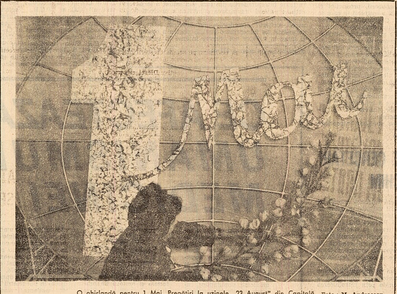
O ghirlandă pentru 1 Mai. Pregătirea la uzinele „23 August” din Capitală.

ște unul factori multipli. În ordinea de idei a comentariului nostru, revin asupra deficiențelor practice clinice formative, a insuficienței educației a li- auliului medic prin exemplul personal, a egoismului spitalului și încoșării a consultărilor cu solicitanți care depășesc cu mult norma legală și posibilă omenească a medicului. Cu excepții, desigur, medicii sînt de re-