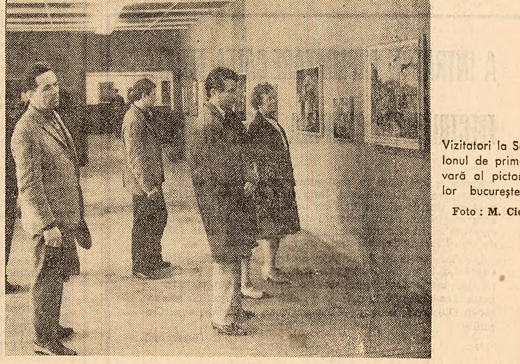
Vizitatori la Salonul de primăvară al pictorilor bucureșteni.

Oaspeții Parcului Herăstrău pot să admire începînd de vineri, pe lângă bogăția de culori a parcului, și cea adunată pe pinzele expuse în cadrul Salonului de primăvară al pictorilor bucureșteni, deschis în pavilionulele A, B și C, sub auspiciile Uniunii Artiștilor Plastici și ale Comitetului pentru cultură și artă al orașului București. Peisaje, flori, naturi statice, portre-