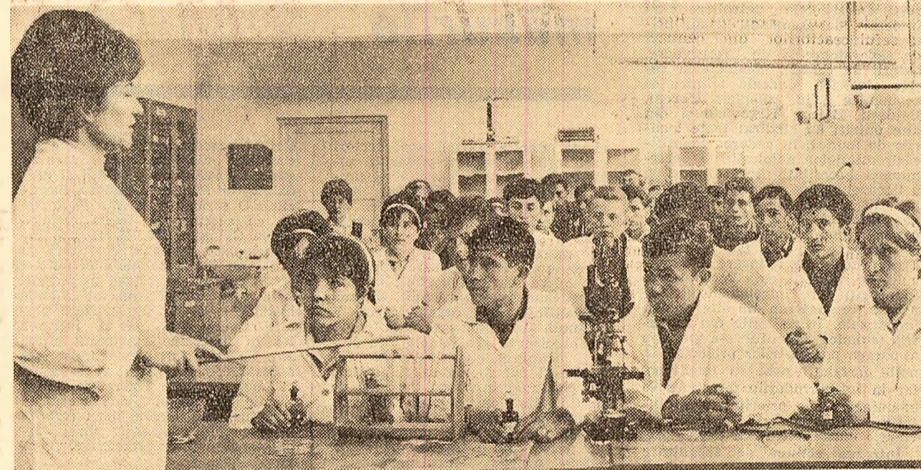
Oră de aplicații practice la liceul agricol din Tg. Mureș.