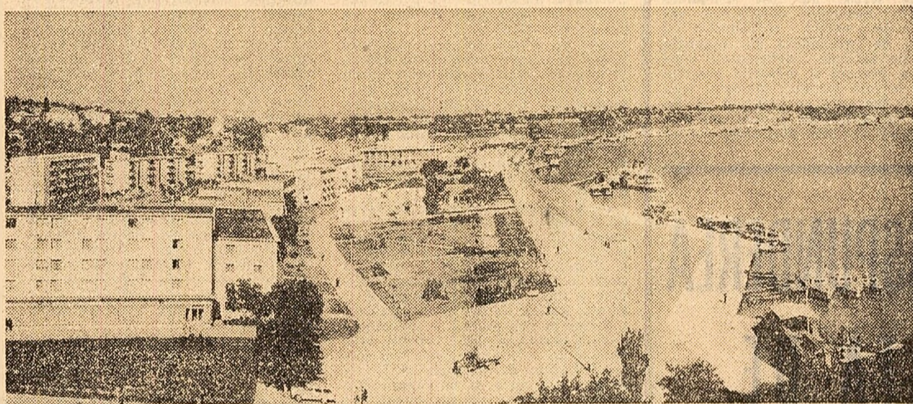
Vedere panoramică a orașului Tulcea