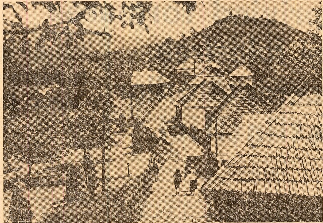
Un pitoresc colț de natură: comuna Tisa din regiunea Argeș