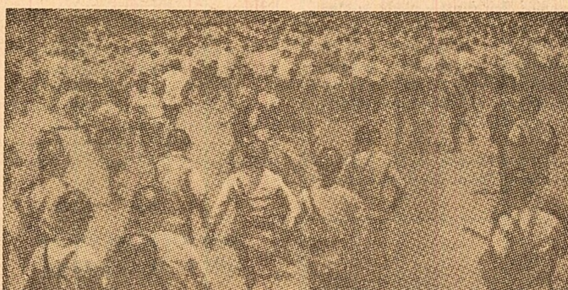
La Seul și în alte orașe ale Coreei de sud se desfășoară mari demonstrații de protest împotriva fraudelor comise în cursul recentelor alegeri parlamentare. În imagine: impotriva participării în manifestația din capitala sud-coreeană 1.000 de polițiști au făcut, cu de obicei, uz de bastoanele de cauciuc

● BAGDAD. Irakul a reluat duminică pomparea petrolului spre rafinăriile din Tripoli (Liban) pentru a satisface nevoile locale. A fost permisă, de asemenea, cu câteva zile în urmă, scurgerea petrolului și spre Siria, pentru necesitățile locale.