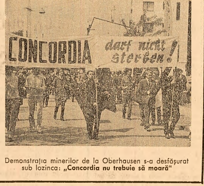
Demonstrația minerilor de la Oberhausen s-a desfășurat sub lozincă: „Concordia nu trebuie să moară”

Funeraliile lui Eugénie Cotton, președinta Federației Democratice Internaționale a Femelor și președinta Uniunii Femelor Franceze, au avut loc luni după-amiază la cimitirul din Sen-