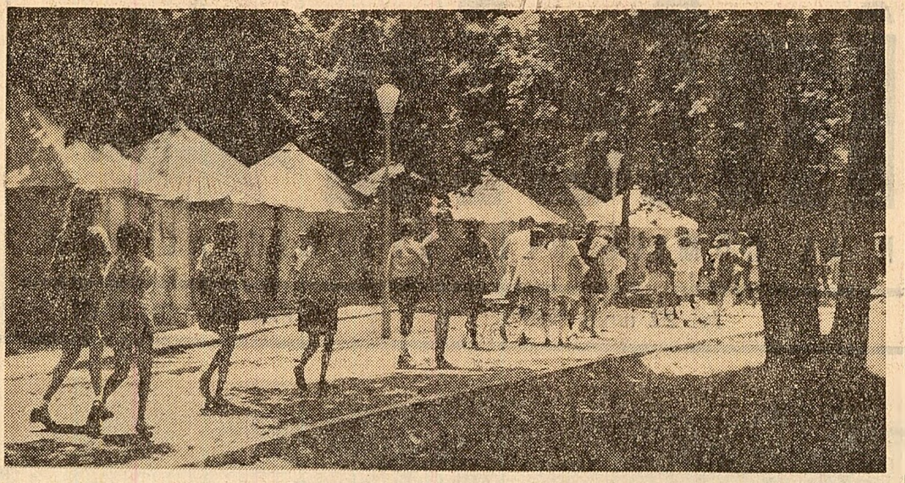
În tabăra de pionieri și școlari Pustnicul