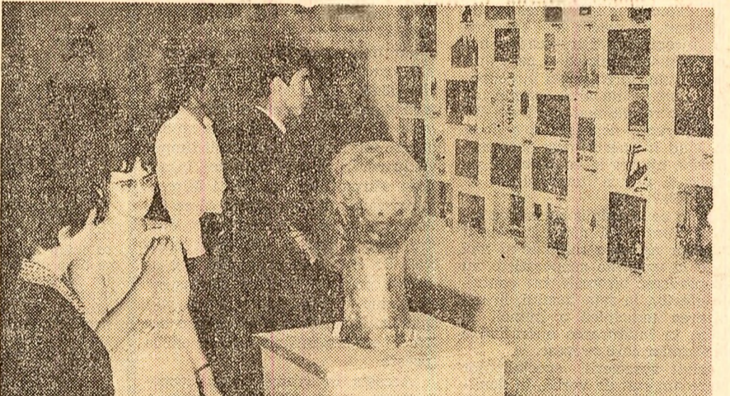
In parcul Herăstrău s-a deschis expoziția de sfîrșit de an a școlii populare de artă.

Despre plan mondial, după cite știu, există două atitudini față de actual teatral. „Trupa” ce se adună în jurul unei vedete alege textul și celelalte elemente „de actor, repertoriu, parteneri în slujba servirii vedetei”. Evident, pot fi spectacole bune și din această concepție de teatru. Există și o altă atitudine fundamentală opusă, anume aceea a făturii unui colectiv în care toți factorii creatori contribuie la realizarea de o valoare unitară. Dacă în prima situație alegerea repertoriului se face pentru doi sau trei oameni din trupă, în cea de-a doua membrii echipei își închină efortul creator pentru a servi și crea un teatru de concepție și repertoriu. În condițiile noastre, consider că o mentalitate eronată și periculoasă „egoismul artistic”, egoism creat de servetele de o lozincă străină nouă „fiecăre cu interesul lui”.