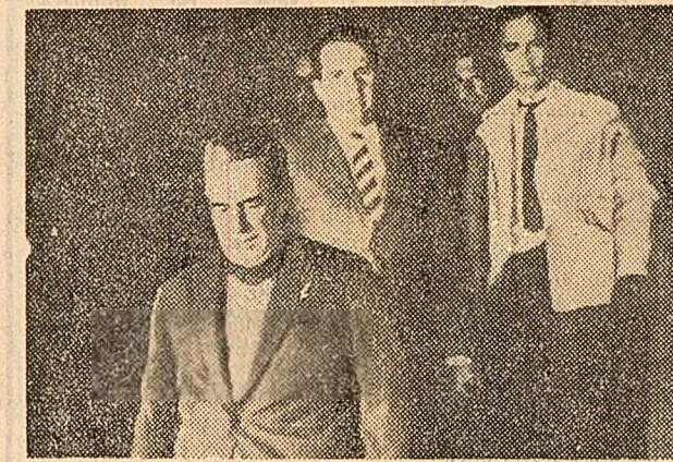
După extrădarea sa din Brazilia, criminalul de război nazist Franz Stangl — vinovat de asasinarea a 700.000 de deportați în lagărele morții din Sobibor și Treblinka — a fost adus la Düsselldorf (R.F.G.) unde vineri a cumpărut în fața unui judecător de instrucție care a emis un mandat de detențiune preventivă

siune se examinează posibilitățile de dezvoltare în continuare a cooperării economice, precum și unele probleme privind lărgirea schimburilor de mărfuri dintre Republica Socialistă România și Iran. După ședința plenară, care s-a desfășurat într-o atmosferă de prietenie și înțelegere reciprocă, au început lucrările în subcomitete.