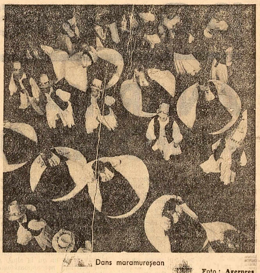
Dans maramureșean