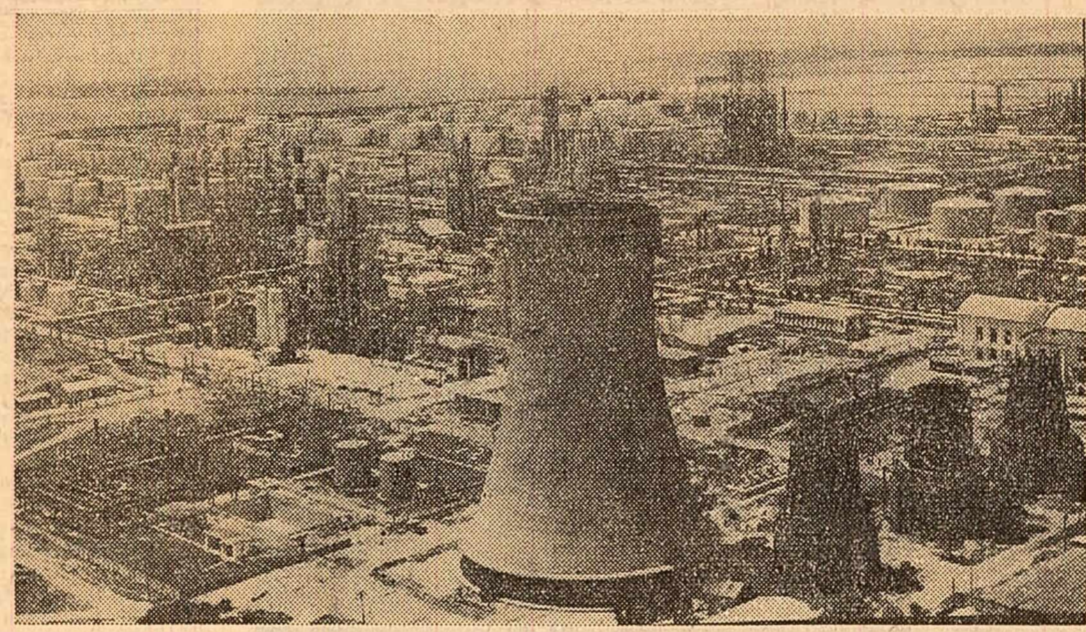
Combinatul petrochimic de la Brazi.