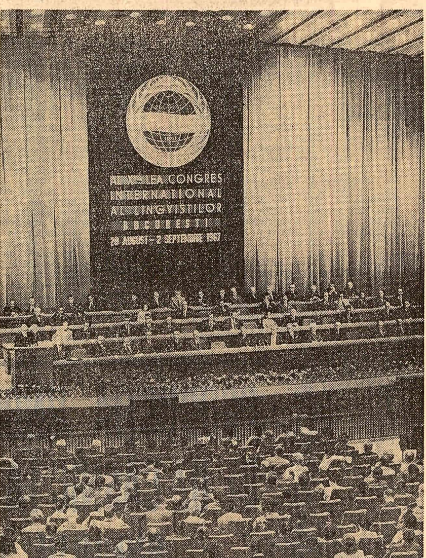
Tradițiile științifice și culturale

Onorați participanți, Ne place să credem că alegerea orașului București ca loc de desfășurare a acestui Congres, ca și a celui de romanizare din primăvara anului 1968, este un semn de prețuire a activității științifice românești din domeniul filologiei și al lingvisticii.