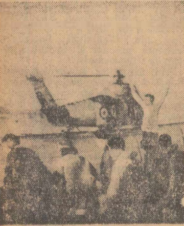
Unități ale trupelor britanice staționate la Aden părăsesc acest teritoriu

„Poporul din Aden nu va înceta lupta împotriva forțelor de ocupație atâta timp cât ultimul soldat britanic nu va părăsi teritoriul și nu vor fi realizate aspirațiile noastre”, a declarat secretarul general al F.L.O.S.Y., Abdel Mackawee, cu prilejul unei manifestări consacrate împlinirii a patru ani de la declanșarea luptei armate a patrioților din teritoriile Arabiei de sud. Arătând că victoria patrioților este aproape, secretarul general al Frontului de eliberare al sudului ocupat al Yemenului a adăugat că se impune să se facă noi eforturi „în vederea realizării unității naționale” în Aden și celelalte teritorii ale Arabiei de sud.