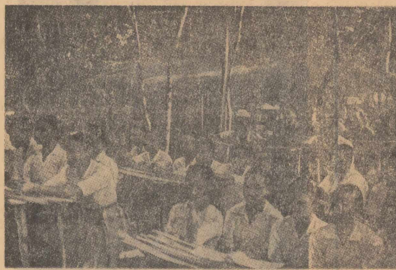
O școală organizată de forțele patriotice din Guineea, așa-zisă „portu-gheză”, în una din regiunile eliberate

Răspunsul la multe din problemele care confruntă