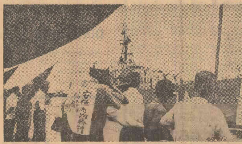
Proteste împotriva ancorării în portul japonez Niigata a unui distrugător american din flota a 7-a, care a participat la operațiunile din Vietnam

La propunerea secretarului general al P.C.U.S., participanții la miting au păstrat un moment de reculegere în memoria eroilor căzuți la Stalingrad. Apoi el a inaugurat monumentul și a aprins flacăra care va arde veșnic în Pantheonul Eroilor.