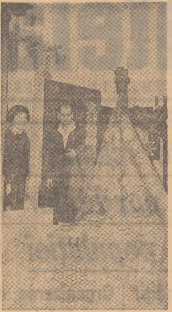
Expoziția de scoarte populare, deschisă la Muzeul satului din Capitală, cuprinde peste 70 de piese autentice reprezentînd arta populară din diferite regiuni ale țării