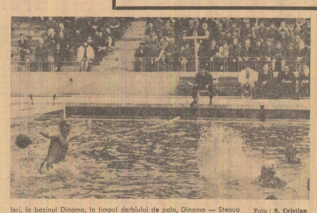
Ieri, la bazinul Dinamo, în timpul derbyului de polo, Dinamo — Steaua

● S-A ÎNCHIEIAT SEZONUL DE CICLISM PE VELODROM (reprezentanții clubului Olimpia București campioni la proba cu antrenament mecanic) ● FOTBAL — Farul Constanța performera etapei: 4-0 cu Dinamo București ● Campionatul republican de rugbi ● Alte știri din țară și de peste hotare