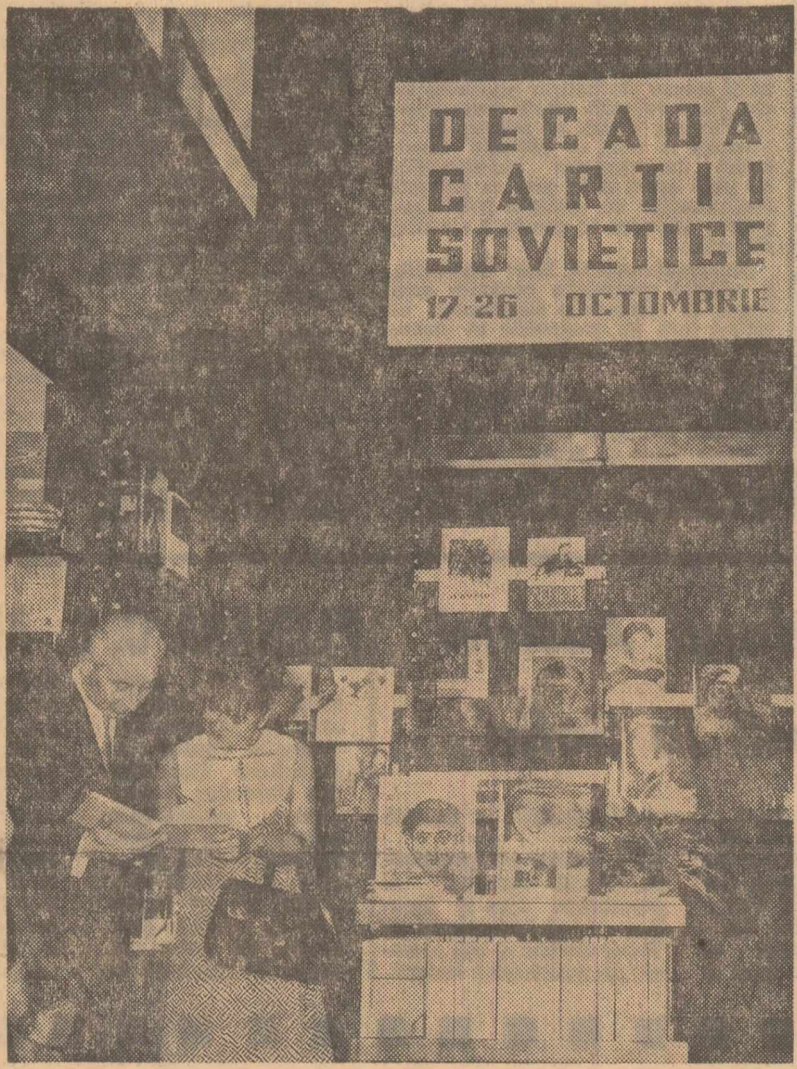
DECADA CĂRŢII SOVIETICE 17-26 OCTOMBRIE

După cîte am fost informat, mai bine de 60 la sută din suprafaţa de expunere este rezervată construcţiilor de maşini. Acest sector important al economiei sovietice va infăţişa publicului românesc multe de tipuri de maşini şi utilaje multe dintre ele constituind cele mai recente creaţii. Vor fi prezentate, printre altele, maşini şi utilaje pentru industria poligrafică (trac-toare de diferite tipuri, maşini a-