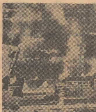
Un incendiu de mari proporții a izbucnit duminică la un complex industrial olandez de la Emmen. Aproximativ 30 milioane de florini. Fotografia oferă o privire de ansamblu asupra complexului cuprins de flăcări.

Cancelarul Austriei și soanelor care îl însoțeau au fost întâmpinați de Todur Jivkov și alți membri ai guvernului bulgar.