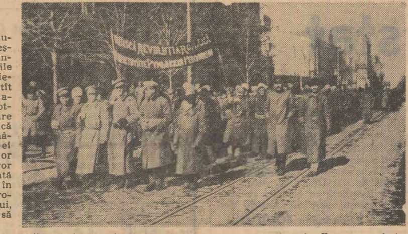
Ostași din batalionul revoluționar român constituit la Odesa, purtînd steaguri roșii și pancarta „Trăiască revoluția română”