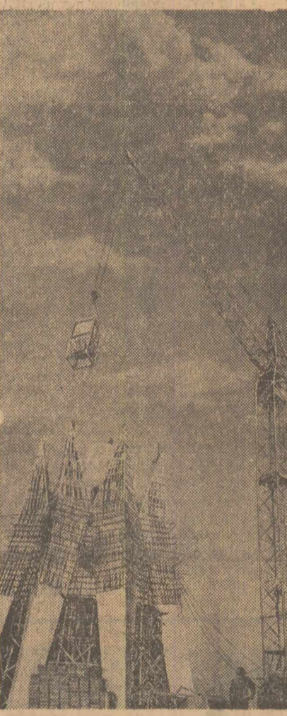
Turn de apărare al unei vechi cetăți medievale? Nicădecum. Este castelul de apă în construcție la Combinatul siderurgic Galați.

ÎN ZIARUL DE AZI ● Istoria gândirii filozofice românești ● Documentele Plenarei C. C. al P. C. R. din 5-6 octombrie în dezbateră ● Resursele jurnalului de călătorie ● Viața artistică ● Sport