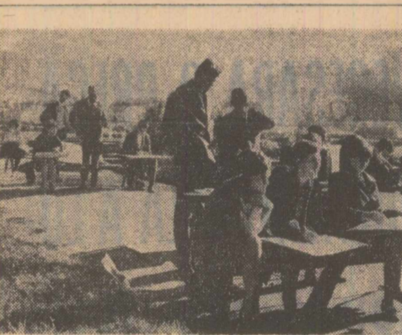
Ora de desen în aer liber (Studentii ai Institutului de arhitectură „Ion Mincu” din Capitală).