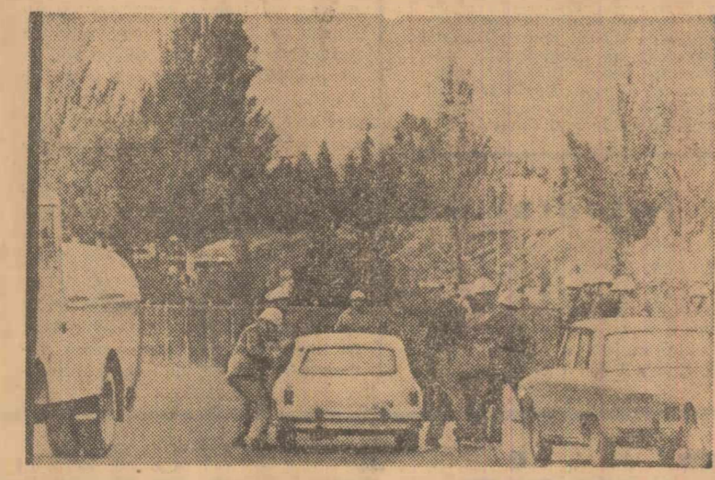
Citeva mii de studenți din Madrid au demonstrat joi și vineri împotriva politicii oficiale. Forțele polițienești, așa cum se vede și în fotografie, au angajat lupte deschise cu manifestanții.

Tot vineri, un grup de 14 țări, între care și S.U.A., au prezentat un proiect de rezoluție în care afirmă că orice modificare a reprezentării Chinei la O.N.U. constituie o problemă „de fond” și prin urmare o hotărâre în acest sens trebuie să fie luată cu o majoritate de două treimi.