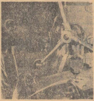
Locje practic lo una din școlile profesionale din Coasta de Fildeș

Guvernele Kenyei și Somaliei prezintă documentul, sint de acord să-și consacre toate eforturile necesare menținerii relațiilor de bună vecinătate, precum și pentru menținerea păcii și securității de ambele părți ale frontierei dintre cele două țări. Ei și-au dat, de asemenea, asentimentul pentru a împiedica orice atenție la vieții umane sau proprietăți în aceste regiuni și de a se abține de la acțiuni ostile de propagandă. Cei doi oameni de stat și-au exprimat acordul și în ce privește abolirea treptată a stării de urgență în regiunile de frontieră și în vederea restabilirii relațiilor diplomatice.