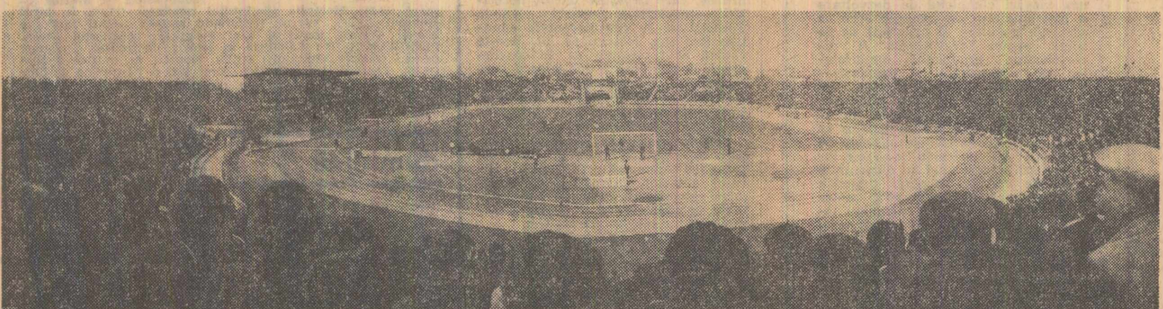
Noul stadion „Central” din Craiova, în timpul meciului inaugural dintre selecționatele secunde de fotbal ale României și Poloniei