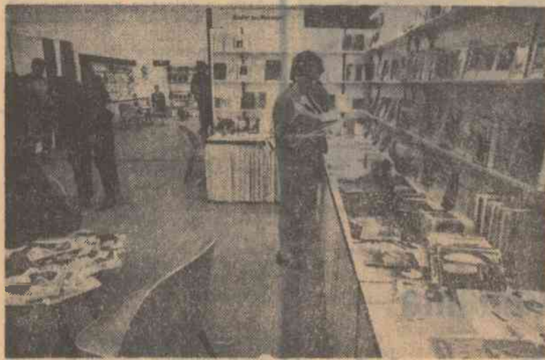
Standul Republicii Socialiste România la Tîrgul internațional al cărții de la Frankfurt (R.F. a Germaniei)

Pe de altă parte, mașinile și instalațiile achiziționate din țările avansate nu sînt în general supuse la taxe ca urmare a scutirilor prevăzute de legile pentru încurajarea dezvoltării industriale. Astfel balanța schimburilor între țările avansate și cele slab dezvoltate devine tot mai nefavorabilă acestora din urmă. Decalajul comercial apreciat la 20 miliarde dolari anual capătă proporții tot mai mari și aceste joacă un rol primordial în adîncirea prăpastiei dintre țările bogate și țările sărace, exprimată prin aceea că 2/3 din omenie nu dispune într-un an nici de o treime din cheltuielile necesare într-o lună. Semnificative au fost datele citate de reprezentanții latino-americani: între 1955 și 1966 pierderile provocate de relațiile inegale de schimb s-au ridicat la dublul valorii totale a exporturilor pe ultimii trei ani ai acestei perioade. Re-