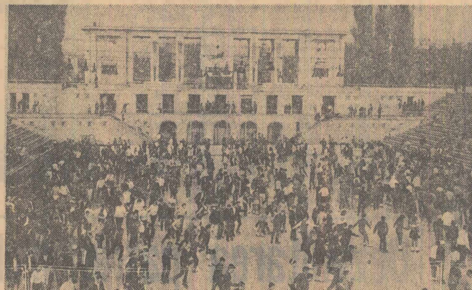
Patinoarul artificial „23 August” din Capitală a fost „asaltat” ieri de numeroși amatori ai patinoajului