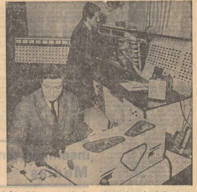
La întreprinderea pentru raționalizarea și modernizarea instalațiilor electrice

În regiunea Maramureș a început construcția unui nou obiectiv din sistemul energetic național — Stația de transformare 220/110 kV — 220 MV — Baia Mare. Prima de această tensiune și putere dintr-o serie preconizată a se construi în regiunea Maramureș, viitoarea stație va contribui la îmbunătățirea alimentării cu energie electrică a industriei din această parte a țării, precum și la extinderea posibilităților de electrificare rurală. Potrivit proiectului, în dotarea stației vor intra aparate de comandă, măsură, semnalizare și protecție cu dirijare automată, fapt ce permite supravegherea funcționării agregatorilor și instalațiilor. Alimentată cu energie electrică direct de la centrala termoelectrică Ludus, stația urmează a intra în exploatare în 1969.