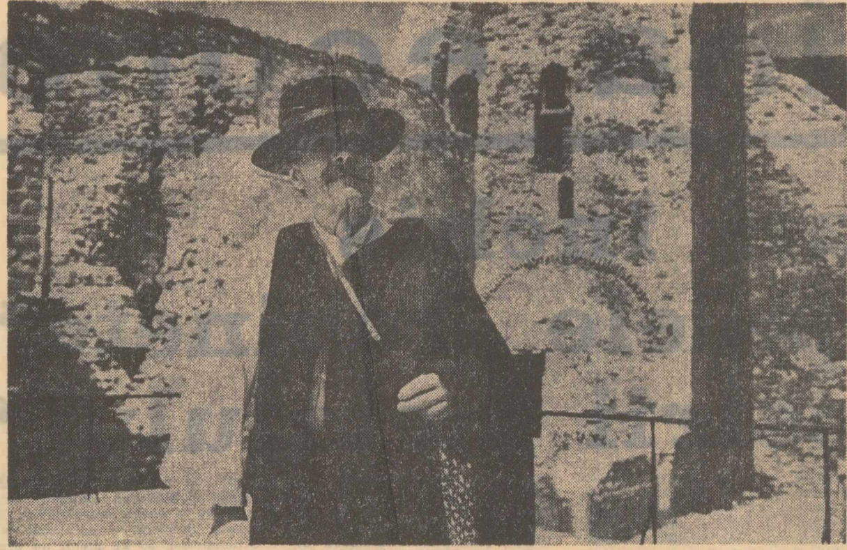
În vizită la Cetatea Neamului