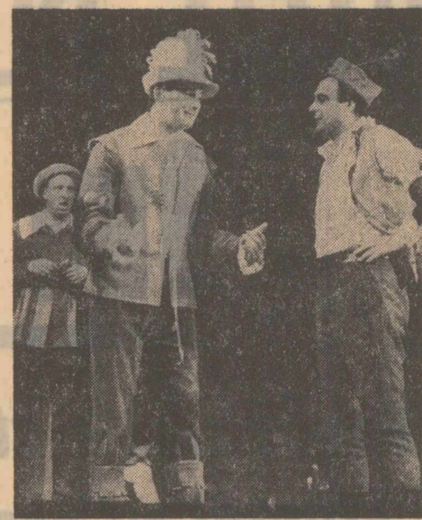
Moment din spectacolul „Egmont” de Goethe în interpretarea colectivului Teatrului de stat din Bacău

În fiecare monografie textual un savant sau de un specialist însoțit cu planșe și reproducându-se cu o bibliografie schide drumul unei mai adâncite cunoașteri a vestigiilor istorice și a culturii dezvoltate în patria noastră.