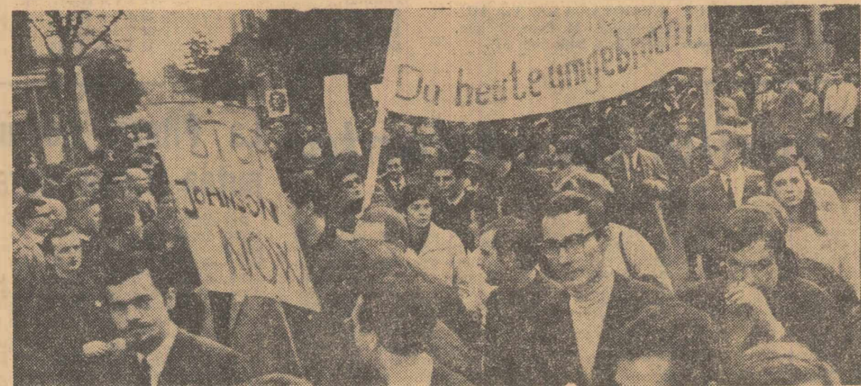
Sute de demonstrații, pe străzile Berlinului Occidental, cer încetarea agresiunii americane în Vietnam

populației sub pretextul lichidării mișcării de guerilă din țară constituie una din cauzele acestei situații explozive. Potrivit aceluiași post de radio, aproximativ 300 de persoane au fost arestate recent sub acuzația de a fi înțreținut legături cu mișcarea de partizani.