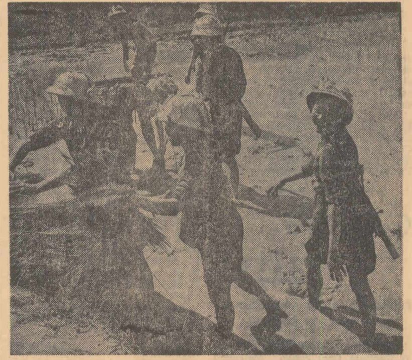
R. D. Vietnam. În fabrici și instituții, pe șantier și pe câmp, întreaga populație îmbracă munca plină de abnegație cu lupta eroică împotriva agresiunii imperialiste, pentru apărarea patriei. În fotografie: încă o plantație de orez este pregătită pentru însămânțare

Observatorii politici apreciază că extinderea relațiilor economice poate duce la îmbunătățirea climatului politic. În acest context, încheie economistul american, Statele Unite nu mai pot continua să ignore această parte a lumii — țările socialiste.