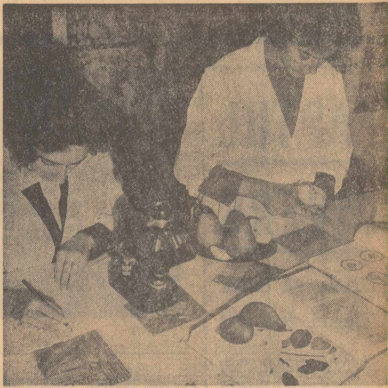
Intr-unul din laboratoarele stațiunii experimentale agricole Argeș