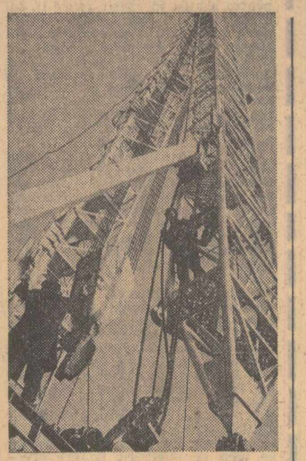
Noua instalație de foraj 3-DH-250 realizată la uzina „1 Mai”-Ploiești