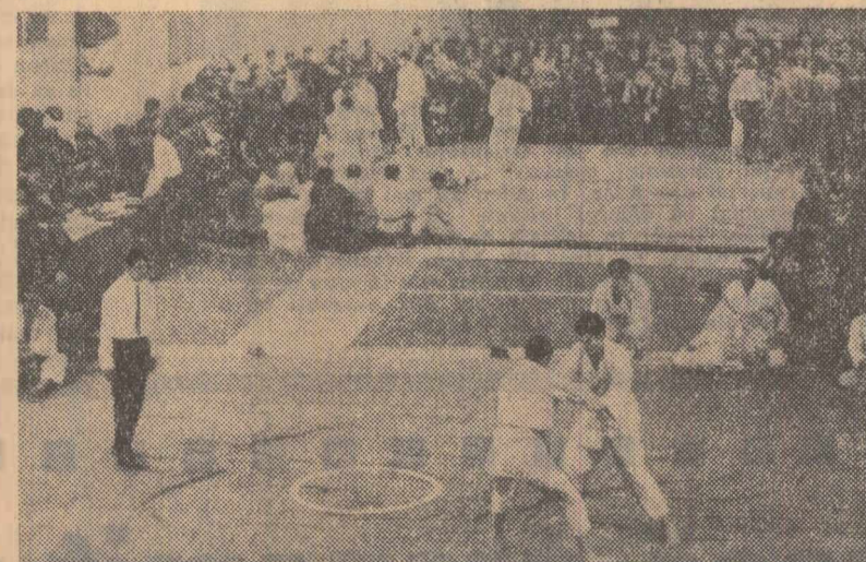
Zilele trecute, în sala Floresca II din Capitală a avut loc campionatul orșenesc de judo. Înfrăcările s-au bucurat de un frumos succes. În fotografie: aspect din timpul competiției