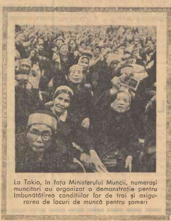
La Tokio, în fața Ministerului Muncii, numeroși muncitori au organizat o demonstrație pentru îmbunătățirea condițiilor lor de trai și asigurarea de locuri de muncă pentru șomeri

Alături de întregul popor român, care vibrează la unison față de soarta împușcatului grec prieten de dictatura militară, intelectualii din țara noastră sînt de partea oamenilor de cultură, a tuturor forțelor din Grecia luptătoare pentru democrație și libertate.