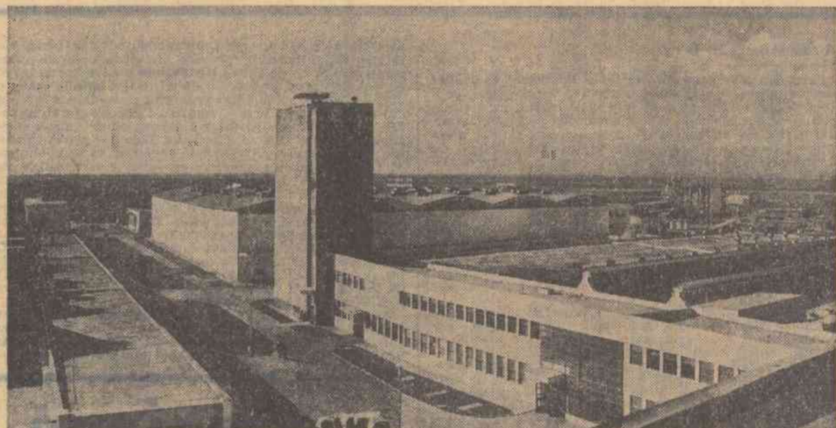
Din peisajul industrial al orașului Constanța