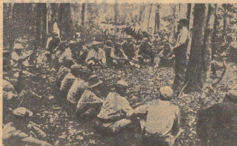
În Angoia mișcarea de eliberare națională continuă să dea lovitură colonialiștilor portughezi. În fotografie: aspect din timpul unei ore de instrucție a patrioților angolezi