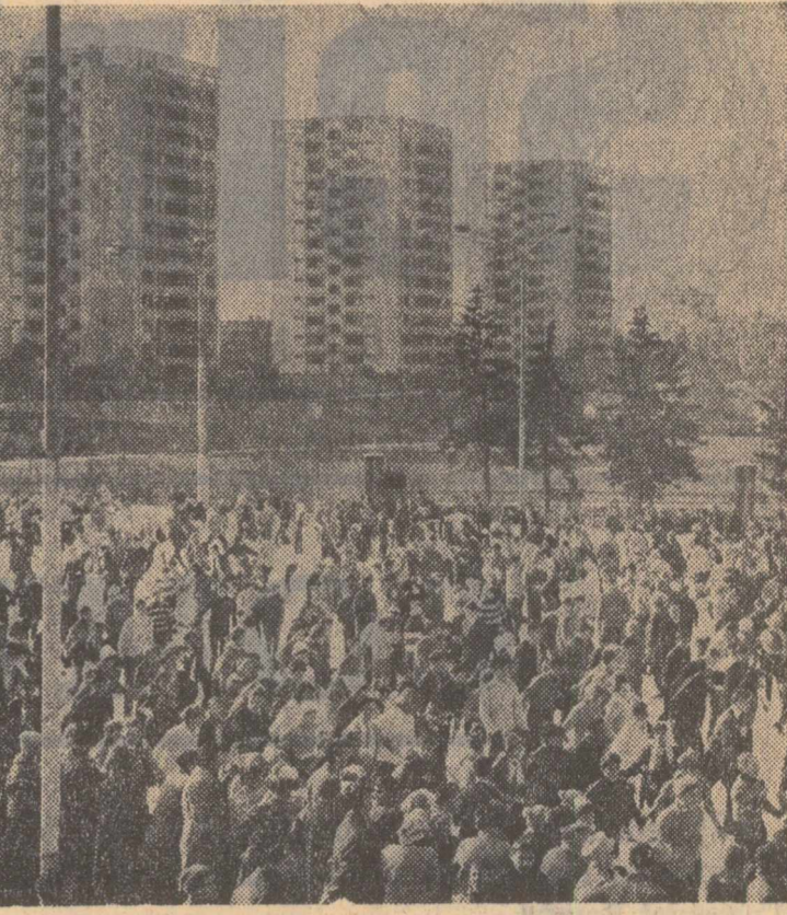
Pe patinoarul artificial Fioresca din Capitală

La 5 decembrie se organizează o nouă trageră a autoturismelor la Loto, după aceeași formulă tehnică aplicată la 7 octombrie și 14 noiembrie. Se atribuie nelimitat premii de cîte 75.000 lei de autoturisme la alegere, autoturism Renault 10 Major, Skoda 1.000 M.B., Fiat 850, Trabant 501, premii de valoare variabilă și fixă. Fiește, și la această trageră participarea pe bilete J de 60 lei oferă mari șanse de cîștig.