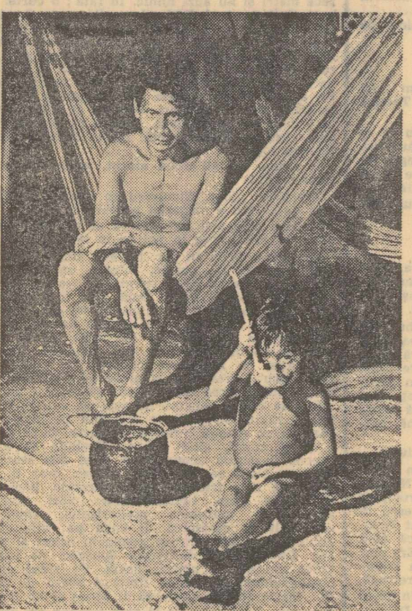
Interiorul locuinței unui indian dintr-un trib din Amazonia

de agil în mișcări. Acum vreo 40 de ani era doar un nume obscur în mulțimea celor ce-și căutau norocul prin locurile astea. Cum singur mărturisese, „a învins în viață”. Cum anume a învins e treabă complicată, pe care probabil nu-