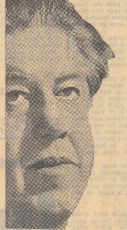
cu Michel Simon