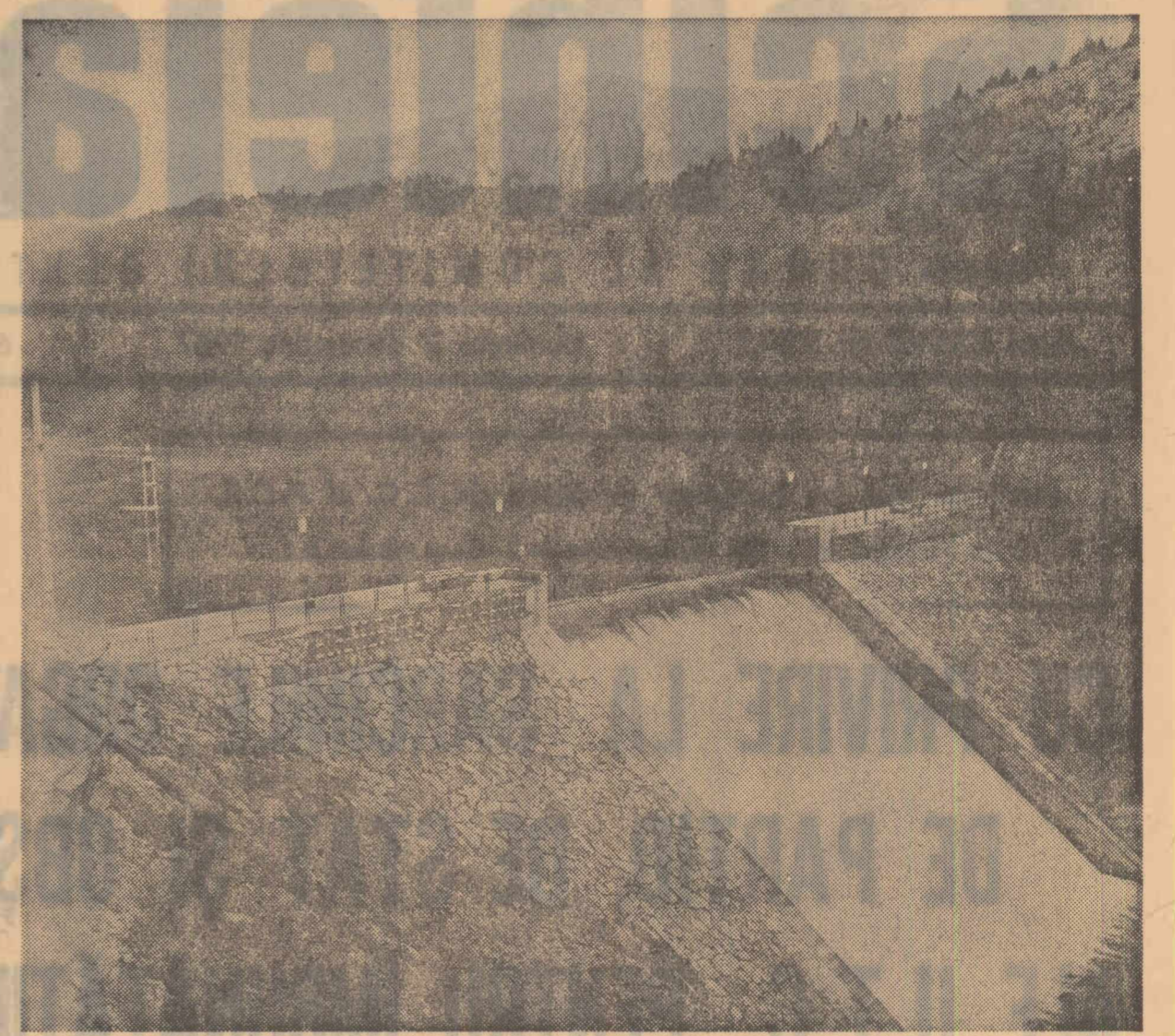
Noul lac de acumulare de pe Olt, la poalele Hășmașului Mare. Apa alimentează exploatarea minieră Bălan

Comitetul Central al Partidului Comunist Român își exprimă convingerea că măsurile privitoare la activitatea în rîndul tineretului vor permite ca munca educativă să se desfășoare în condiții din ce în ce mai bune, să sporească rolul școlii al familiei, al instituțiilor de cultură, al celorlalte organizații obștești în formarea tinerii generații de constructori ai socialismului și comunismului.