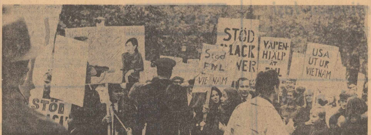
Coștlenii ai Stockholm-ului demonstrează împotriva războiului dus de Statele Unite în Vietnam

rezultatul aplicării progresului tehnic, îmbunătățirii organizării producției, mecanizării lucrărilor în mine. El a subliniat totodată necesitatea sporirii eforturilor pentru creșterea productivității muncii, concentrarea extracției și dezvoltarea mecanizării. Vorbitorul a arătat că statul face mari eforturi pentru sporirea producției industriei extractivă deosebite Polonia are nevoie de mai mult combustibil și materii prime, balanța comerțului ei exterior fiind negativă la aceste capitole. În acest scop vor fi alocate importante mijloace pentru construirea de noi mine și extinderea celor existente, pentru creșterea celor mai bune condiții pentru muncitori.