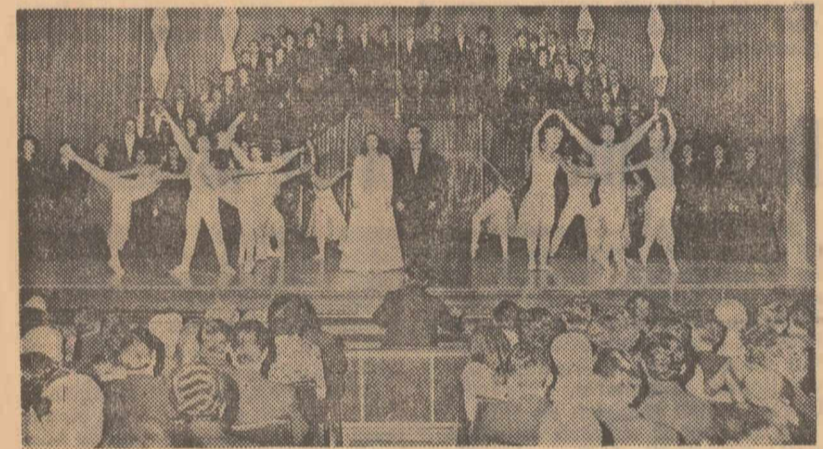
Scenă din spectacolul festiv

Cu prilejul aniversării a 20 de ani de la înființarea Ansamblului, Consiliul Central al Uniunii Generale a Sindicatelor a oferit în seara aceeași zile o recepție în sa-lioanele de marmură ale Casei Centrale ale Armatei.