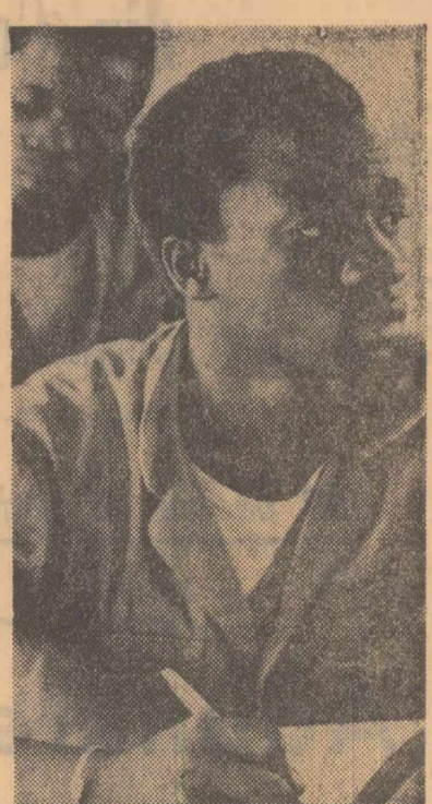
Mali. În timpul unei ore de curs la Centrul de învățămînt profesional-technic din capitala țării, Bamako

Agenția TASS anunță că între 3 și 15 decembrie nave științifice și militare sovietice intenționează să efectueze în partea de nord a Oceanului Pacific cercetări hidroacustice pentru studierea difuzării sunetelor și a profilului geologic al fundului oceanului la sud de insulele Aleutine. În această perioadă vor fi efectuate cîteva explozii submarine, luîndu-se măsuri pentru a se reduce efectele negative care pot rezulta pentru navigație și pescuit.