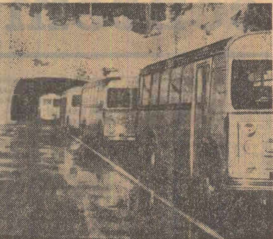
Elveția. La 1 decembrie a fost inaugurat tunelul transalpin, la San Bernardino, cu o lungime de 6,6 km pentru transportul rutier