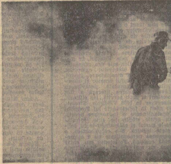
O nouă sarijă la Combinatul siderurgic Hunedoara