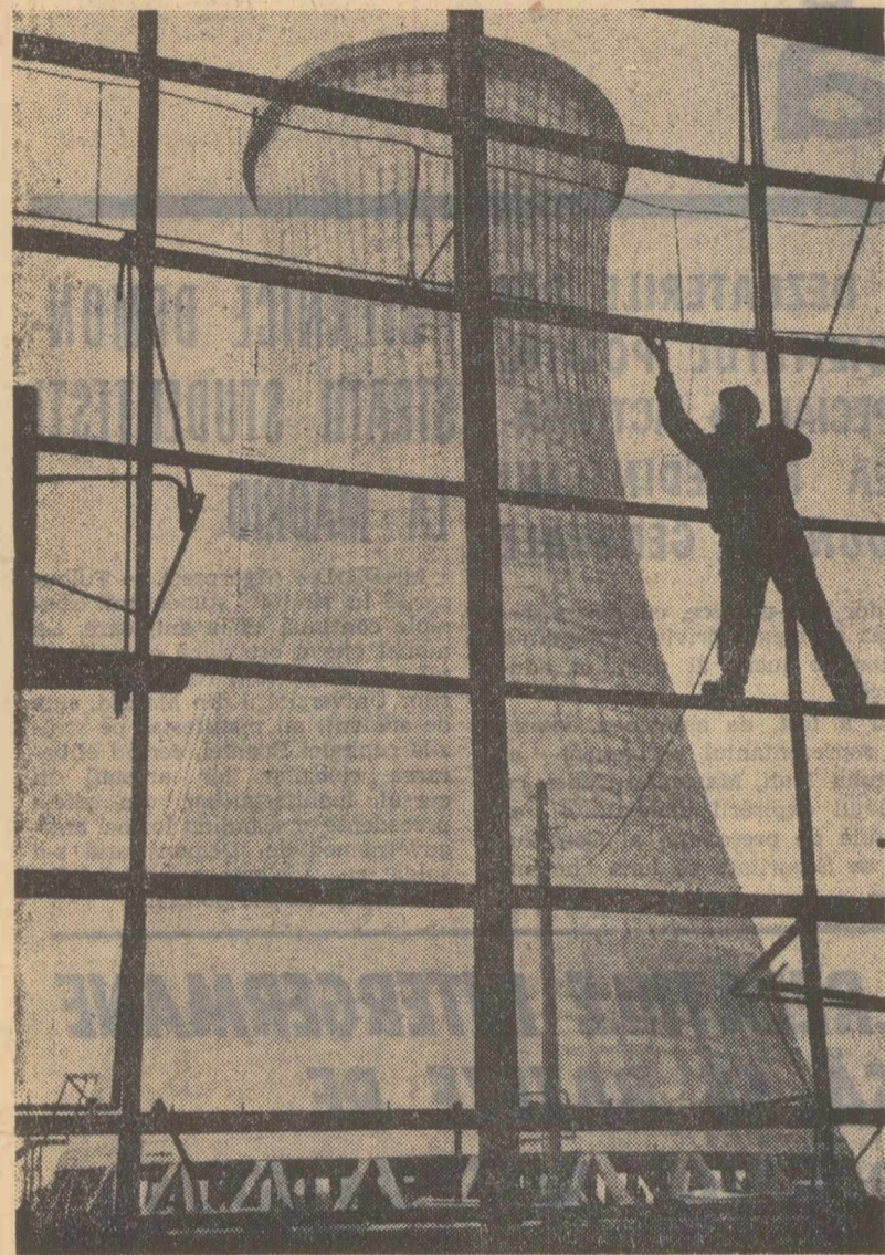
Grafică industrială