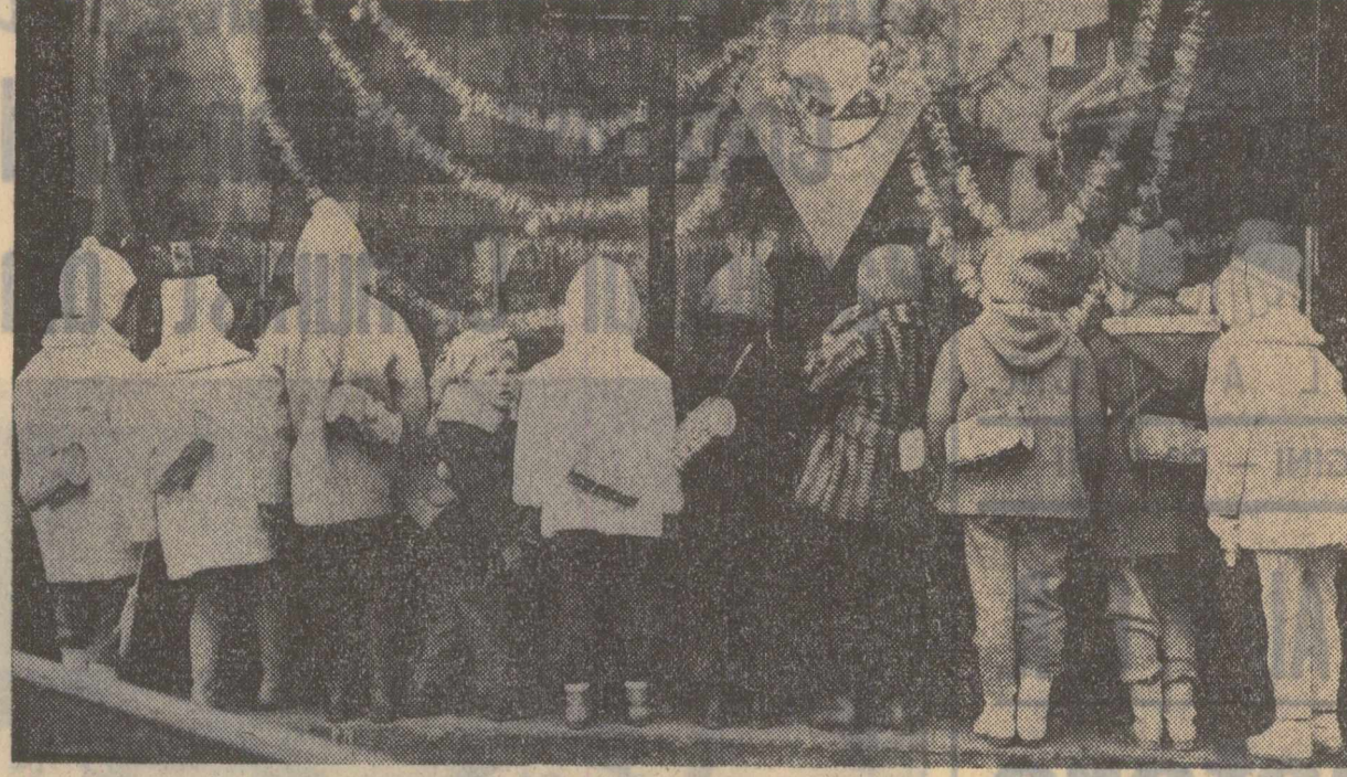
Ce or fi văzut?

Rubrică redactată de: Ștefan ZIDARIȚA Ștefan DINICA cu sprijinul corespondenților „Scinteii”