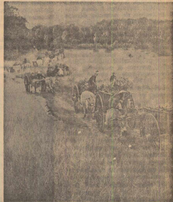
O caravană des înfilită în Vietnamul de sud: jăranii sprijină armata F.N.E. transportând spre zonele de luptă alimente și muniții