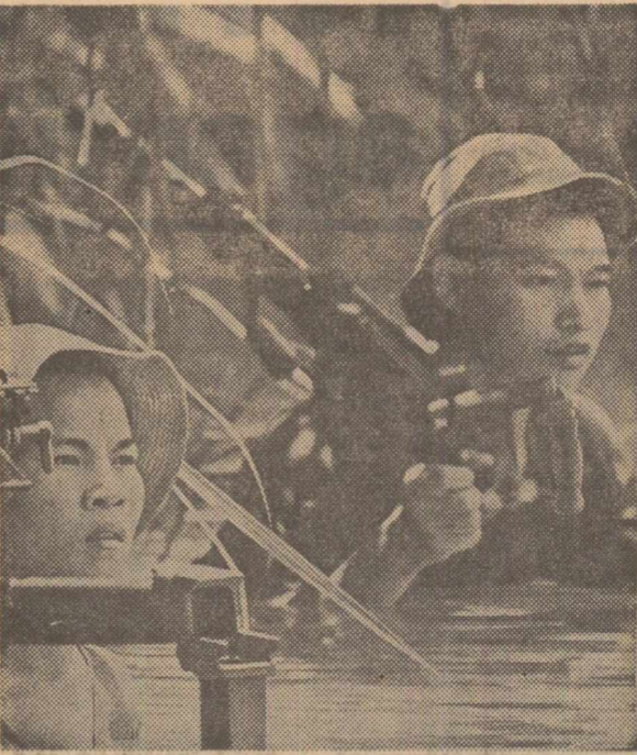
Se pregătește un nou atac. Un grup de partizani se îndreaptă spre posturile inamice

În politică, material și moral și își exprimă convingerea nestrămutată că lupta sa dreaptă va triumfa. Așa cum au subliniat în repetate rânduri conducătorii de partid și de stat ai țării noastre, poporul român condamnă cu hotărâre agresivitatea Statelor Unite în Vietnam. Statele Unite trebuie să înceteze definitiv și necondiționat bombardamentele asupra R. D. Vietnam, să-și retragă trupele de pe teritoriul Vietnamului de sud, să pună capăt tuturor acțiunilor agresive împotriva poporului vietnamez. Poporul vietnamez trebuie lăsat să-și hotărască singur drumul dezvoltării sale fără nici un amestec din afară, potrivit propriilor sale voințe.