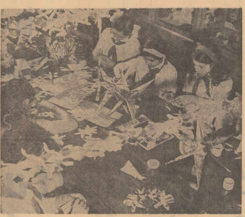
Pregătiri pentru pomul de iarnă la Palatul pionierilor din Capitală.

Rubrică redactată de: Stefan ZIDARITA Stefan DINICA cu sprijinul corpondentilor „Scintei”