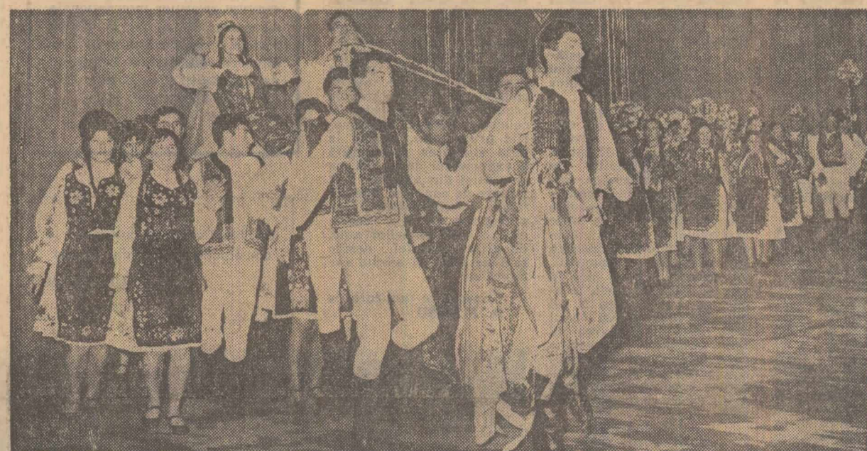
În virtutea dansului (aspect din timpul spectacolului)