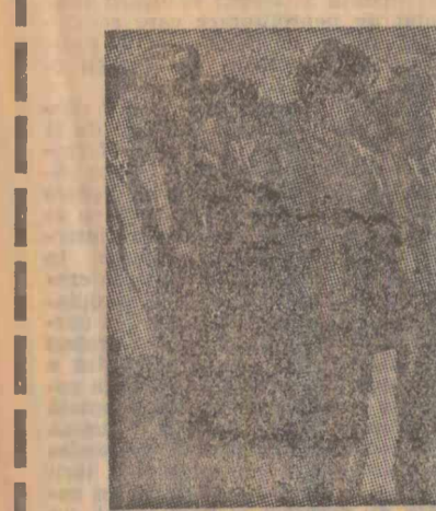
Sanaa. În numeroase piețe ale orașului, adepții regimului republican fac exerciții militare.