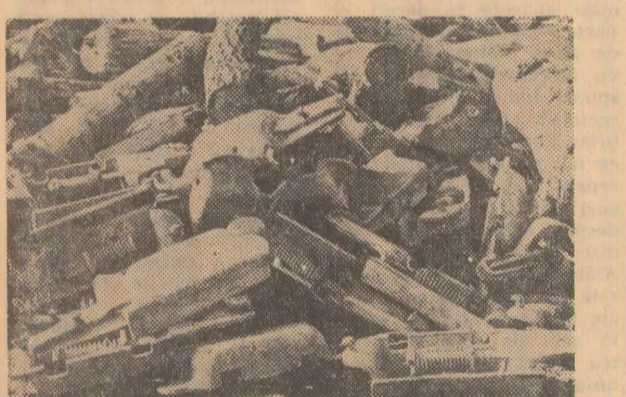
Printre lemnele unei imponente grămezi stau aruncate numeroase piese din metal. Nimeni nu știe ce piese sînt și de unde vin.

Joi la amiază s-au încheiat lucrările colocviului cu tema „Probleme teoretice și metodologice ale determinării eficienței economice a investițiilor”, organizat de Institutul de cercetări economice al Academiei. Lucrările, care s-au desfășurat în cadrul a două secții, au prilejuit o utilă confruntare de păreri, cu participarea altă a cercetătorilor științifici, cit și a specialiștilor din diferite ministere, instituții centrale, institute de cercetări și proiectări. Comunicările prezentate și dezbaterile care le-au urmat au relevat preocupări actuale și realizări ale cercetătorilor noștri în ceea ce privește perfecționarea metodologiei de calcul al eficienței investițiilor și îmbunătățirea continuă a activității economice. Lucrările colocviului au relevat totodată hotărîrea oamenilor de știință de a contribui la transpunerea în viață a programului de măsuri adoptate de Conferința Națională a partidului. (Agerpres)