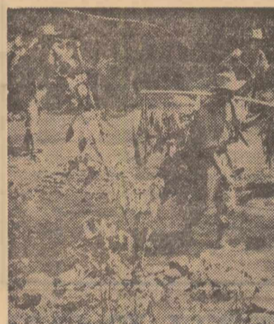
Luptători ai forțelor patriotice din Vietnamul de sud pregătind o nouă acțiune ofensivă în delta fluviului Mekong

padopoulos și Makarezos au fost trecuți în rezervă, nu s-a înregistrat încă o reacție oficială la declarația regelui. În așteptarea unei astfel de reacții, corespondentul A.F.P. vede „în demisia din armată a celor trei oameni care au inspirat și efectuat puciul din aprilie”, expresia dorinței lor „de a se elibera de ultimele legături care l-ar fi putut stînjini în activitatea lor politică”. După cum relatează corespondentul agenției „Associated Press”, zărele grecești de joi dimineață nu au publicat declarația regelui.