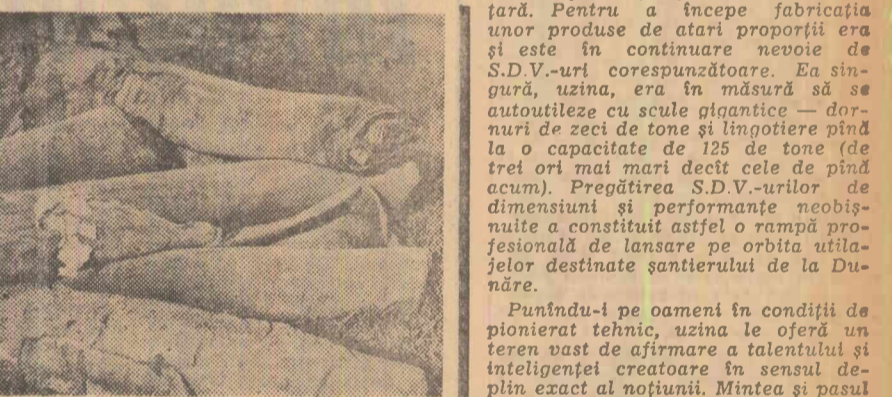
Au fost suluri de pișă astalată...