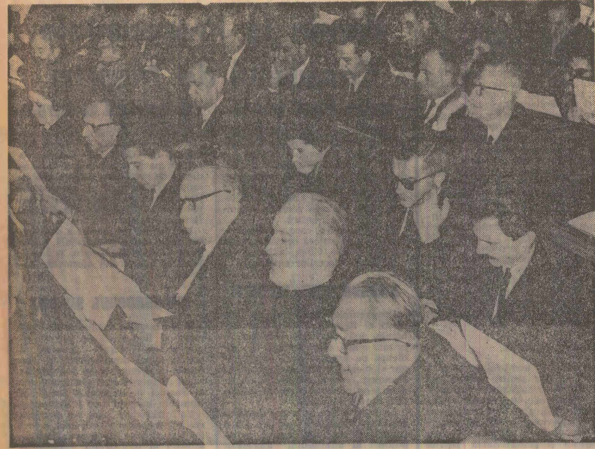
În timpul lucrărilor sesiunii