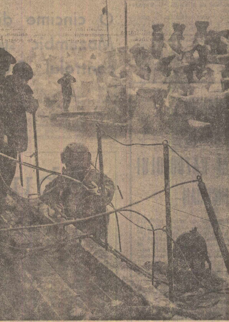
Pe șantierul noului bazin portuar din Constanța.

Numărul de față inserază, de asemenea, lista articolelor publicate în revista „Lupta de clasă” de-a lungul anului 1967.