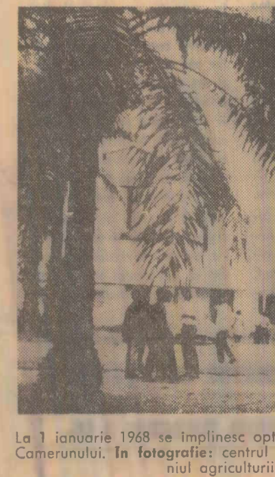
La 1 ianuarie 1968 se împlinesc opt ani de la proclamarea independenței Camerunului. În fotografie: centrul de pregătire a specialiștilor în domeniul agriculturii din orașul Douala

Primarul New Yorkului, John Lindsay, a intervenit personal în conflictul dintre cei 29.000 de lucrători ai liniilor de autobuze și de metro și autoritățile orașului pentru a evita intruperea circulației cu aceste mijloace de transport în timpul sărbătorilor de Anul Nou.