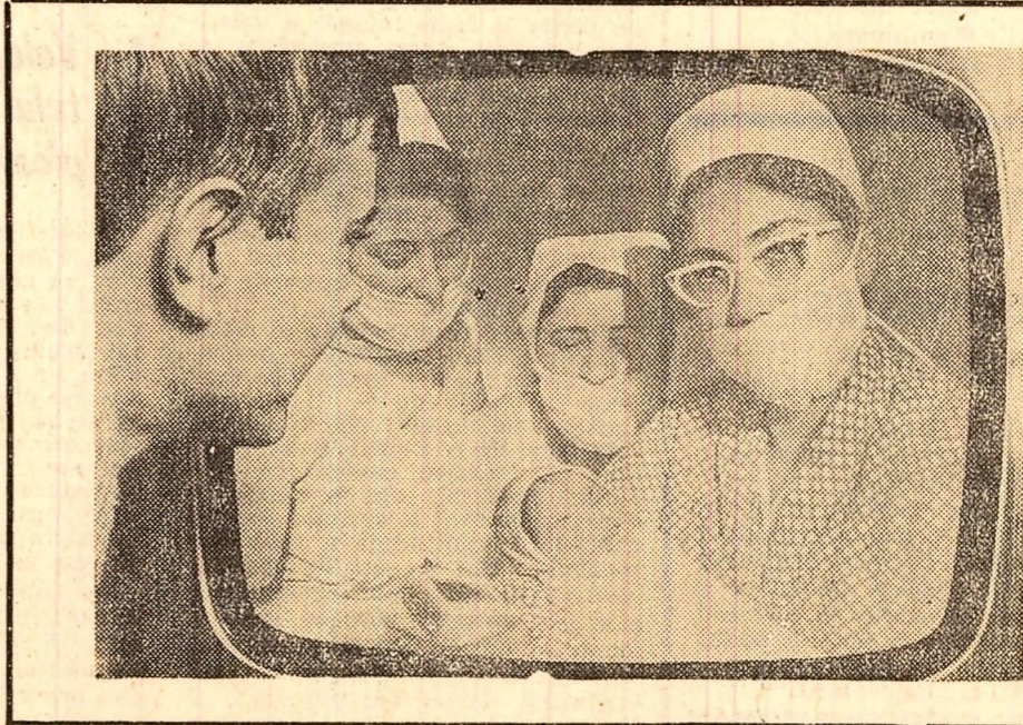
De curînd, la Spitalul clinic de obstetrică și ginecologie Giulești din Capitală a fost pus în funcțiune o instalație de Televiziune în circuit închis. Cu ajutorul ei, proaspeții părinți fac cunoștință mai devreme cu copiii lor fără a perturba sănătatea noilor născuți

Laurențiu VISKI correspondentul „Șcintei”