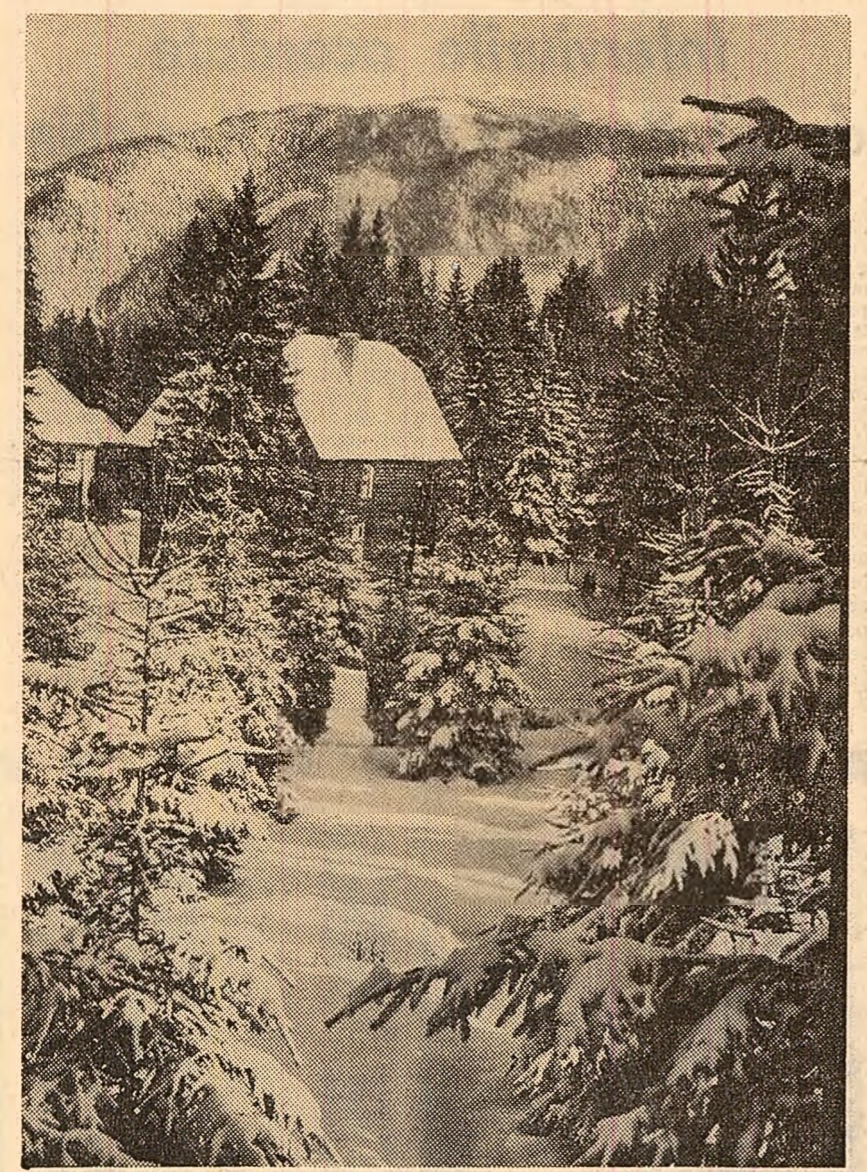
Cabanele din munți vă așteaptă