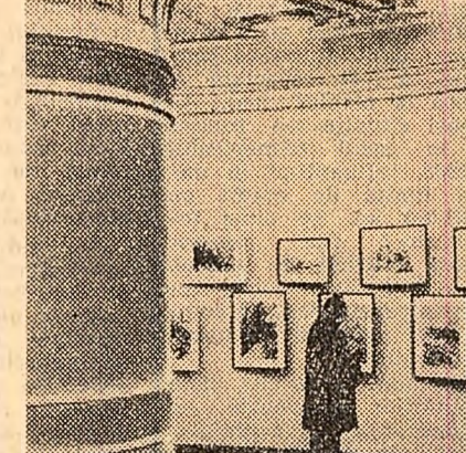
La expoziția retrospectivă R. Iosif, deschisă în sălile Ateneului Român.