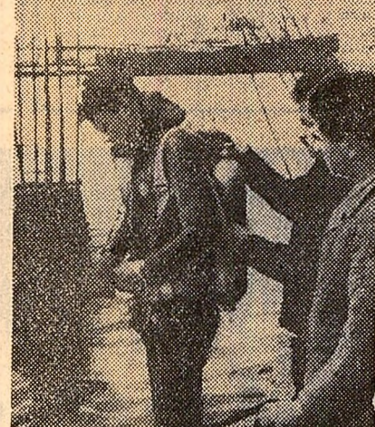
— a confirmat purtătorul de cuvînt oficial al guvernului R.A.U., Hassan Zayat. Este vorba de o primă etapă de studiere în adîncime a canalului pentru a înlătura obstacolele existente. Aceste sondaje, a precizat purtătorul de cuvînt, vor dura 2—3 săptămîni. Răspunzînd unei întrebări a ziariștilor referitoare la cererea Izraelului de a se proceda la demilitarizarea peninsulei Sinai, Zayat a subliniat că ideea creării unor zone demilitarizate a fost totdeauna acceptabilă pentru R.A.U., dar numai în cazul în care și cealaltă parte o acceptă.

La 27 ianuarie vor începe lucrările pentru deblocarea navelor sub pavilion străin din Canalul de Suez