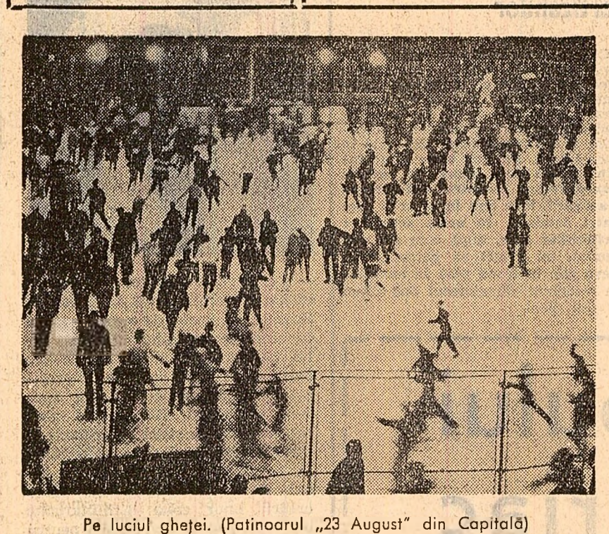
Pe luciul gheții. (Patinoarul „23 August” din Capitală)