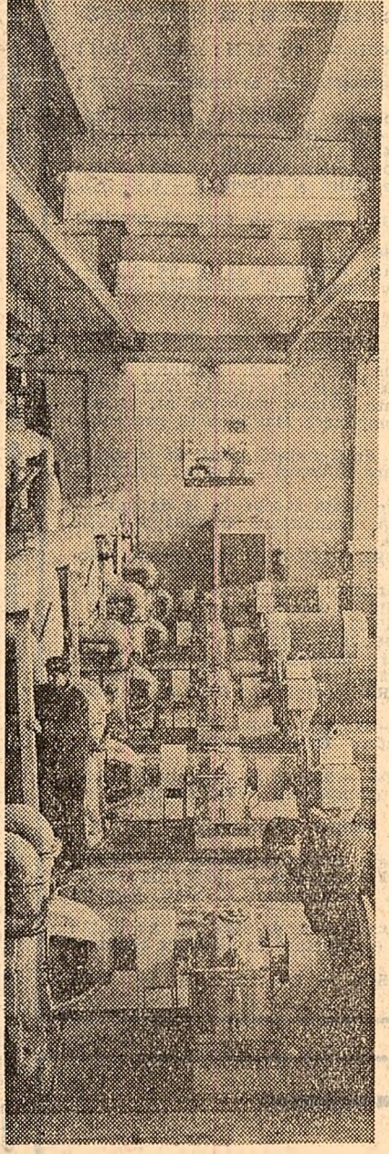
Hala sulfanelor a fabricii de acetaldohidă de la Combinatul chimic Craiova

Insuficient de insistent a acționat ministerul și în cazul unor fabrici și instalații noi de la combinatelor chimice Craiova și Tr. Măgurele, de care am mai amintit, ale căror termene de punere în funcțiune au expirat în planul pe 1967, fără să se dispună de documentația tehnico-economică. Iar termenul de punere în funcțiune a fost stabilit în trimestrul IV. Superficialitatea și-a spus cuvîntul. Lucrările nu s-au "acținat" la începutul anului, ci abia în iunie, stabilindu-se pentru 1967 un plan minimal din valoarea totală a investiției. Așa se face că la data cînd instalația de la Orăștie trebuia să producă, lucrările nu erau executate decât în proporție de variată între 20—60 la sută. Hala compresoarelor și tronsonul 2 din hala spălăre-calcinare nici nu erau începute, din lipsa proiectelor de execuție și neconstrucții unor utilaje. Pus în fața faptului împlinit, ministerul a apelat cu urșurată la soluția amînării termenului de punere în funcțiune a instalației... în 1969.