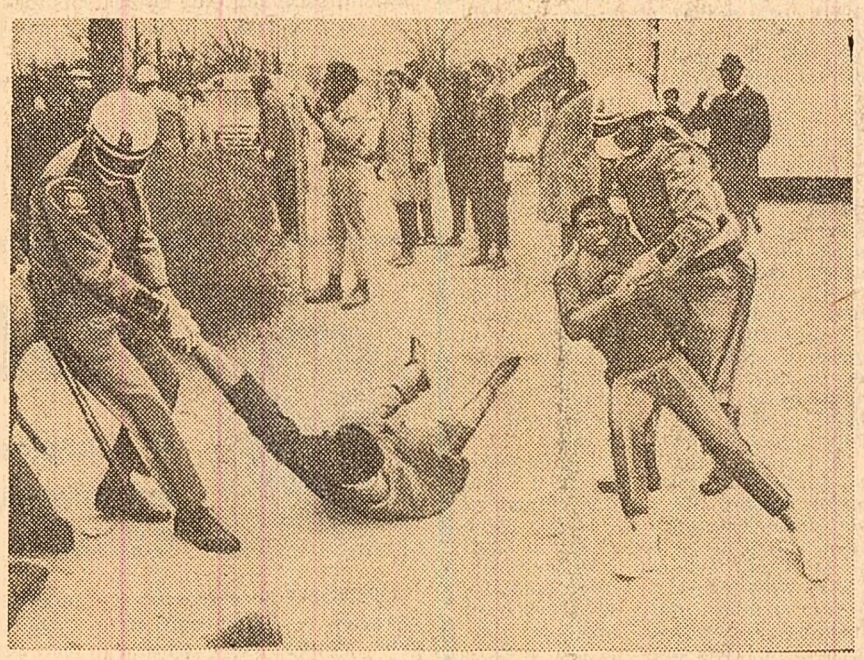
leri, în localitatea Social Circle din statul Georgia (S.U.A.) poliția a reprimat o demonstrație a negrilor pentru drepturi civile