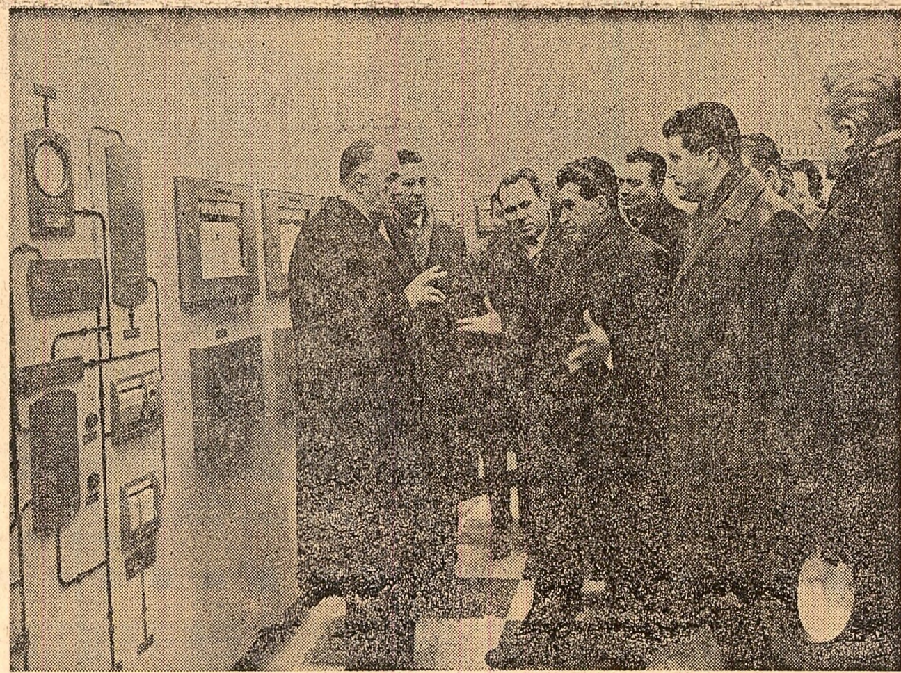
În fața panourilor de comandă ale complexului de cracare catalitică de la rafinăria Brazi