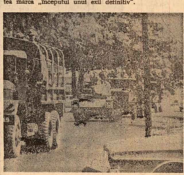
La Santo Domingo au avut loc zilele trecute cîmîri între poliție și studenți. În fotografie: un convoi de tancuri înconjurînd clădirea Universității din capitala dominicană

Regele Constantin, împreună cu familia, a părăsit vineri seara ambasada Greciei din Roma, unde se afla de la 12 decembrie, stabilindu-se la hotelul „Eden”. Observatorii politici din capitala Italiei consideră că schimbarea reședinței de către rege ar putea marca „începutul unui eci definitiv”.